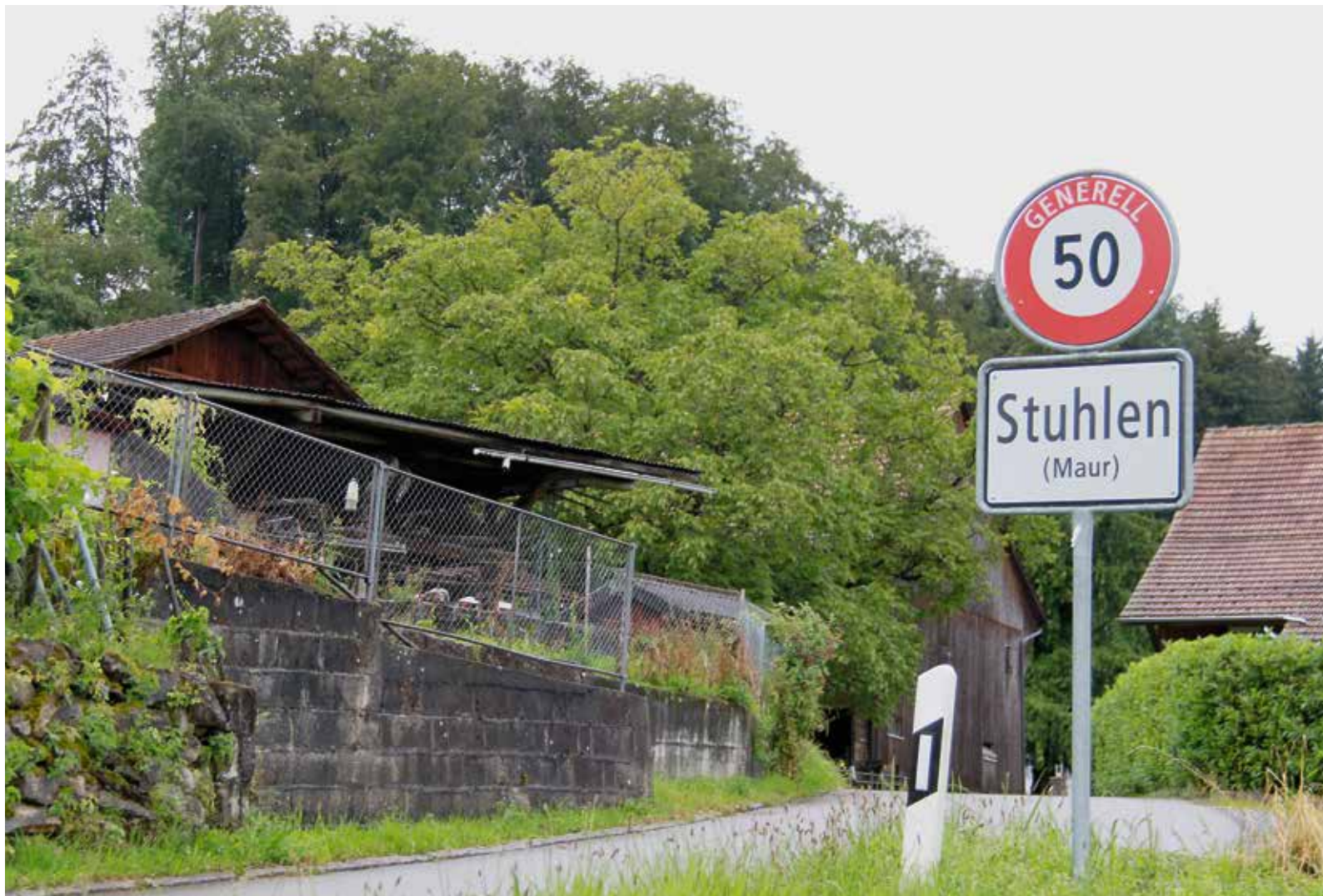
Der Weiler Stuhlen gehört zu Ebmatingen, ist aber eine kleine Welt für sich.