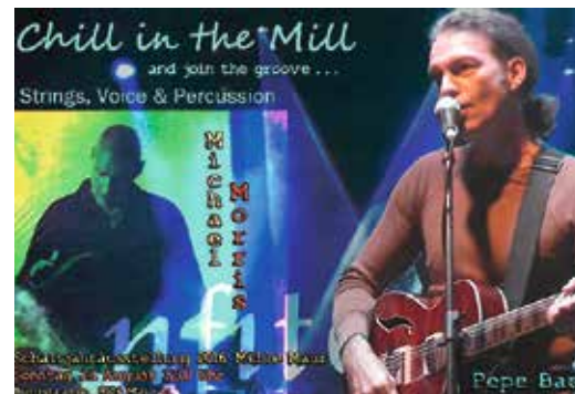
«Chill in the Mill».