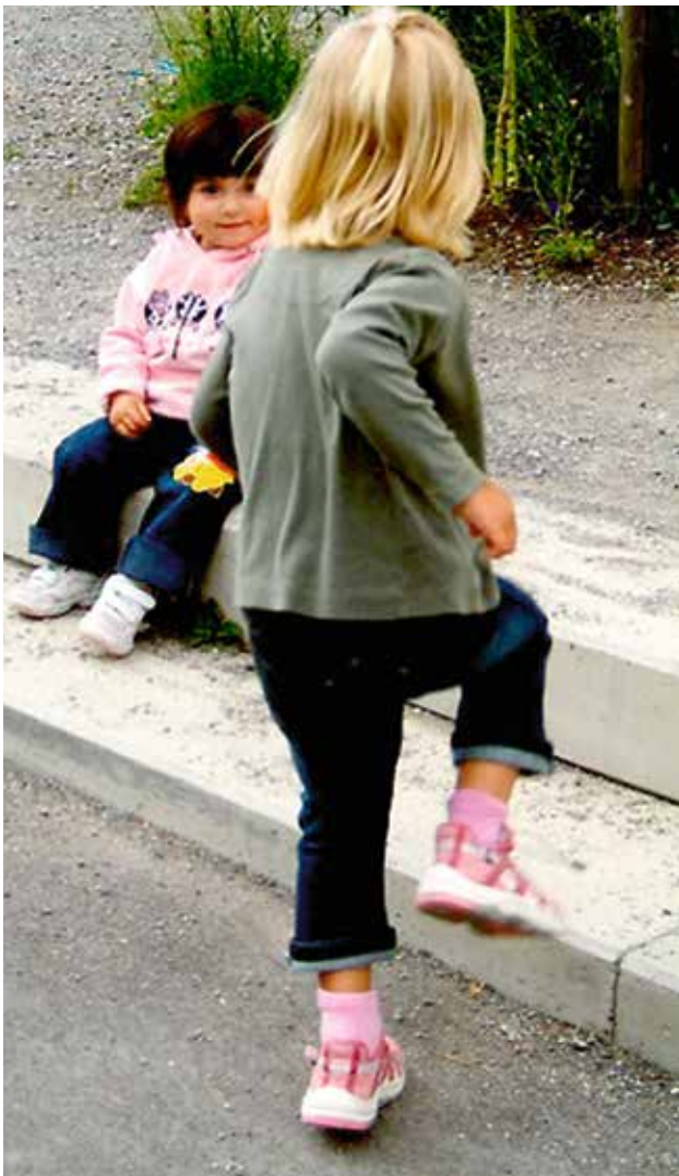
Am Dorffest Binz.