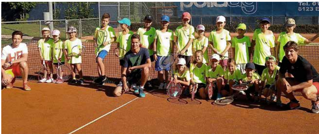
Die tennisbegeisterten Kinder des Sommerncamps mit ihren Tennislehrern.