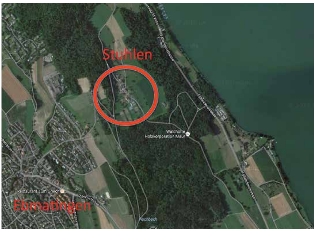
Der Weiler Stuhlen liegt abgelegen zwischen Ebmingen und dem Greifensee.

Wir berichten in loser Folge über Weiler und abgelegene Höfe. Kleine Siedlungen, ausserhalb der Dorfteile Uessikon, Aesch, Maur, Ebmingen und Binz gelegen.