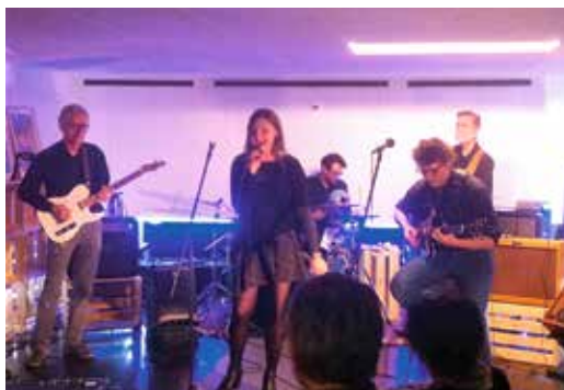
«Prank gone wrong».