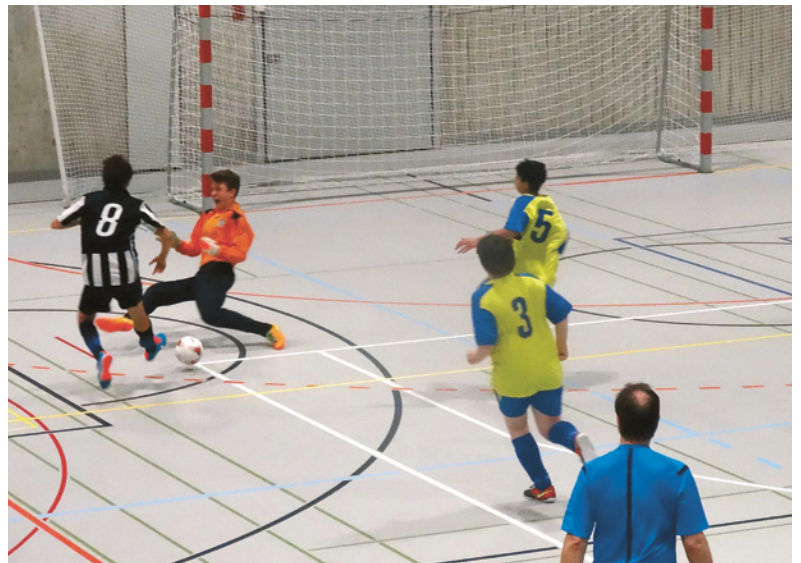
Die Torchance des FC-Maur-Stürmers wird durch den herauseilenden Torwart unterbunden.