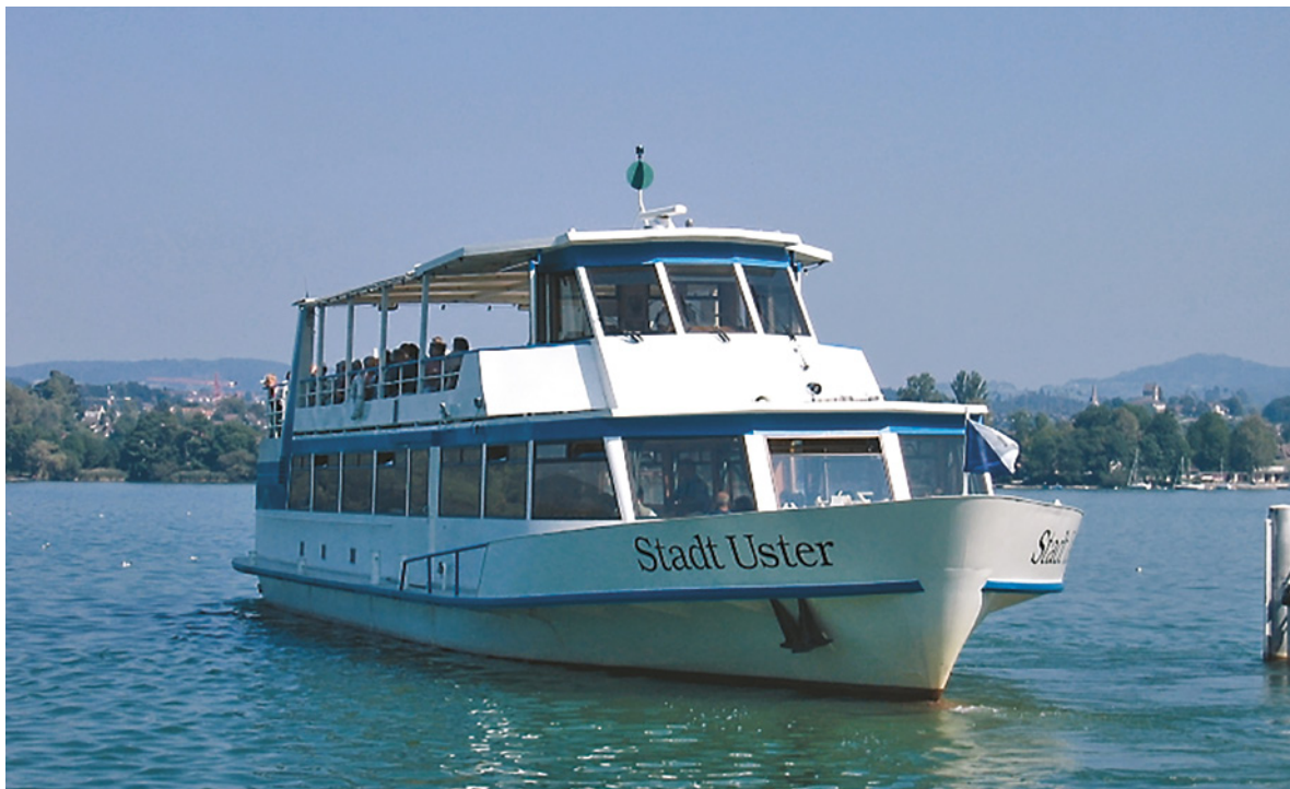
Das grösste Schiff der SGG: Die «Stadt Uster».

Die «Maurmer Post» hat bereits darüber geschrieben, und die Technik-Fans haben ihren Fotoapparat bereitgestellt. Die Auswässerung der beiden SGG-Schiffe «Stadt Uster» und «Herrliberger» steht kurz bevor. Aufwendige Renovationsarbeiten stehen an, damit im Frühling der Betrieb wieder reibungslos auf dem Greifensee stattfinden kann. Noch ist alles im richtigen Zeitplan.