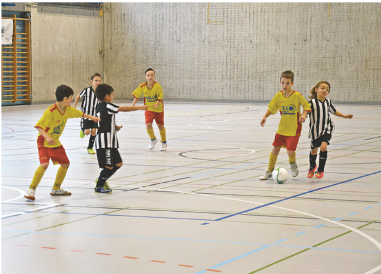
Von allen Mannschaften jederzeit fair geführter Kampf um den Ball.