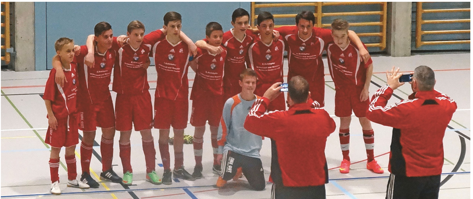
Sieger bei den C-Junioren: FC Uster.