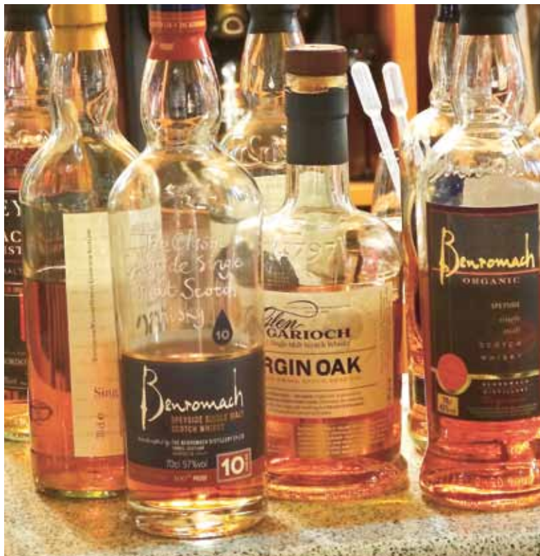
Die Etiketten edler Single-Malt-Whiskys sprechen für den Liebhaber Bände.