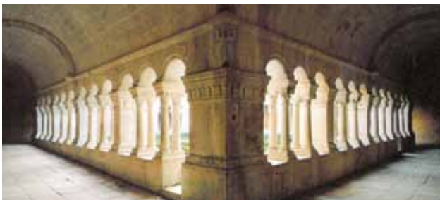
Abbaye Notre-Dame de Sénanque (12. Jh.)

Es ist Charaktersache. Die einen sitzen lieber da wie der Hase im Feld, schnuppern und warten mit hochgestellten Ohren auf alles, was kommt. Die anderen brüten wie Hennen auf Eiern, in denen sie lang gehegte Pläne haben, die bald realisiert werden können. Was ist besser? Abwarten oder planen? Ich weiss es nicht. Wer abwartet, kann sich besser auf Neues einstellen, läuft aber Gefahr, vor lauter Abwarten den Tag zu versäumen. Wer dynamisch vorausorganisiert, motiviert sich selber und erreicht sein Ziel. Manchmal ist er aber dabei so im Schwung, dass er eine Abzweigung verpasst, die für sein Leben wichtig gewesen wäre. Das Leben fordert uns immer heraus. Immer – aber anfangs eines neuen Jahres empfinden wir es bewusster.