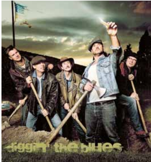
Das Cover der neuen CD: Gebuddelt und den Blues gefunden.