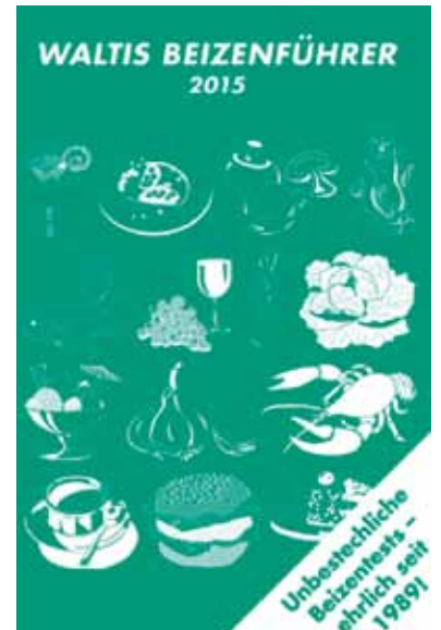
«Waltis Beizenführer 2015» www.waltis-beizenfuhrer.ch

Finden Sie Ihre eigene Kritik bei einem Beizengang durch das Dorf.