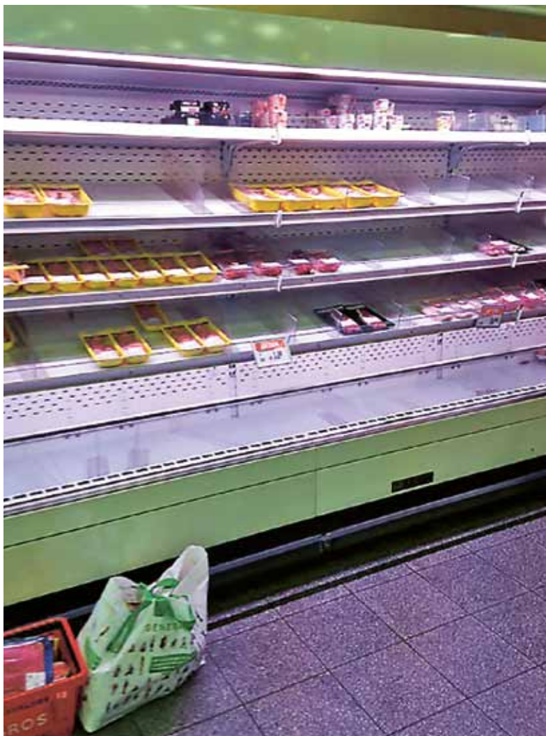
Gespentisch: Die halbleeren Regale in der Migros Ebmatingen Ende Dezember.