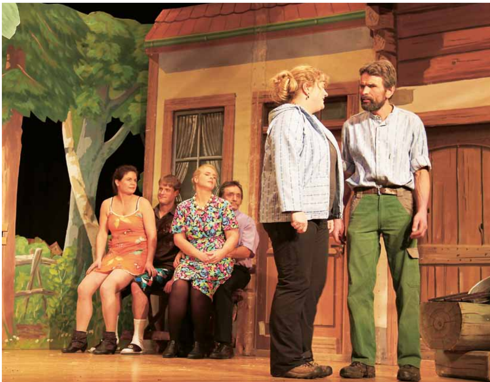
Auf dem «Chabishof» geht es drunter und drüber.

Der Schwank «D Bäähähäx» ist ein Getändel um die Männer. Sie sind rar auf dem abgelegenen Chabishof, und jeder ist recht, der richtige zu sein. Ein Lustspiel in drei Akten mit einem Publikum, das weit anreist für eine Vorstellung.