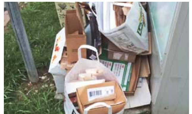
Ein Beispiel, wie der Karton nicht bereitgestellt sein sollte.

In die Kartonsammlung gehören Wellkarton und alle Arten von unbeschichteten Kartonverpackungen wie Schachteln, Früchte- und Gemüsekartons usw. Papier-Couverts können ebenfalls der Kartonsammlung übergeben werden. Nicht in die Kartonsammlung gehören verschmutzter oder mit Kunststoff beschichteter Karton (z.B. Tetrapak) sowie Waschmittelkartons. Solche Arten von Karton sind mit dem Kehricht zu entsorgen. Karton kann auch in Kartonschachteln bereitgestellt werden. Die Schachteln dürfen aber nicht lose herumliegen.