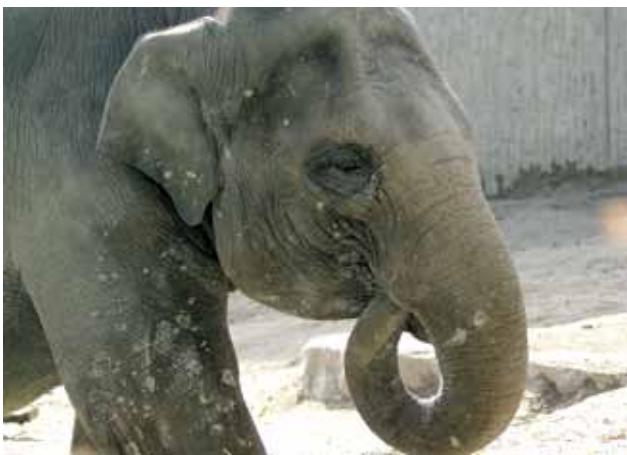
Elefant im Zürcher Zoo.

Es geschah im Herzen des Zulu-Landes am Mhulhuwe-Fluss. Dort, wo einst die Könige Dingiswayo und Shaka jagten. Es ist noch gar nicht so lange her. Die Ältesten, die am Rande des südafrikanischen Umfolozi-Wildparks vor ihren Dorf-Hütten sitzen, nicken lächelnd, wenn die Rede auf die Geschichte von den wilden jungen Elefanten kommt, die alles kurz und klein gehauen, Touristenautos angegriffen, Bäume ausgerissen, Zäune niedergetrampelt und sogar ein paar Nashörner getötet hatten – einfach so, keiner wusste warum.