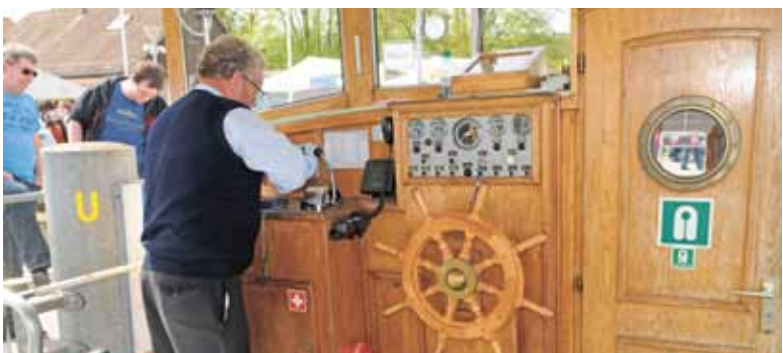
Das Kursschiff «Heimat» mit wunderschönem Holz und alten Armaturen.