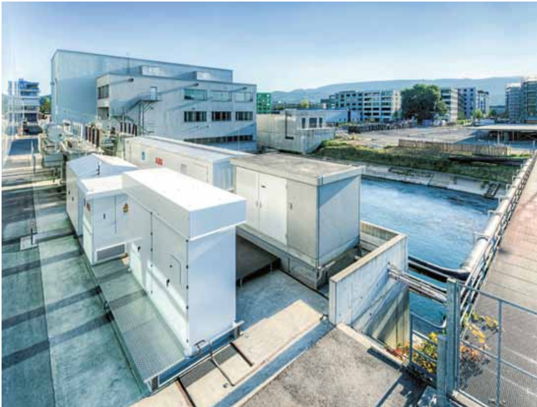
Ansicht des Li-Ionen-Batteriespeichers der EKZ.