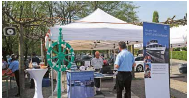
Das Glücksrad für eine Rundfahrt mit der SGG auf dem Greifensee.