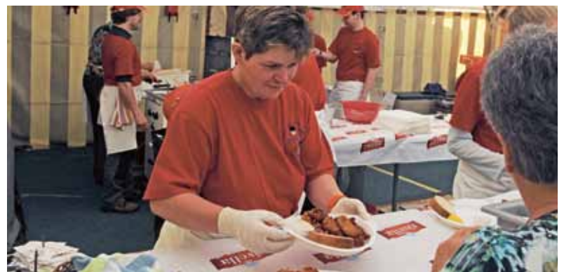
Knusprige Eglifilets gehen über die Theke.