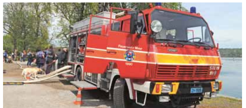
Einblick in das Löschfahrzeug der Feuerwehr Maur am Schiffsteg Maur.