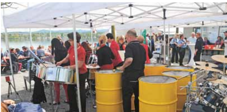
Am Sonntag spielte die Steelband Agagilla am Schiffsteg.