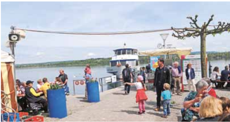
Viele Besucher am Schiffsteg interessierten sich für die SGG-Flotte.