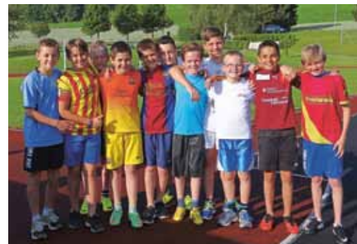
Sporttag in Ebmatingen 2014.

Da die Schulen Aesch und Maur ihre Sporttage erst nach den Sommerferien abhalten, wird in einer späteren Ausgabe darüber berichtet.