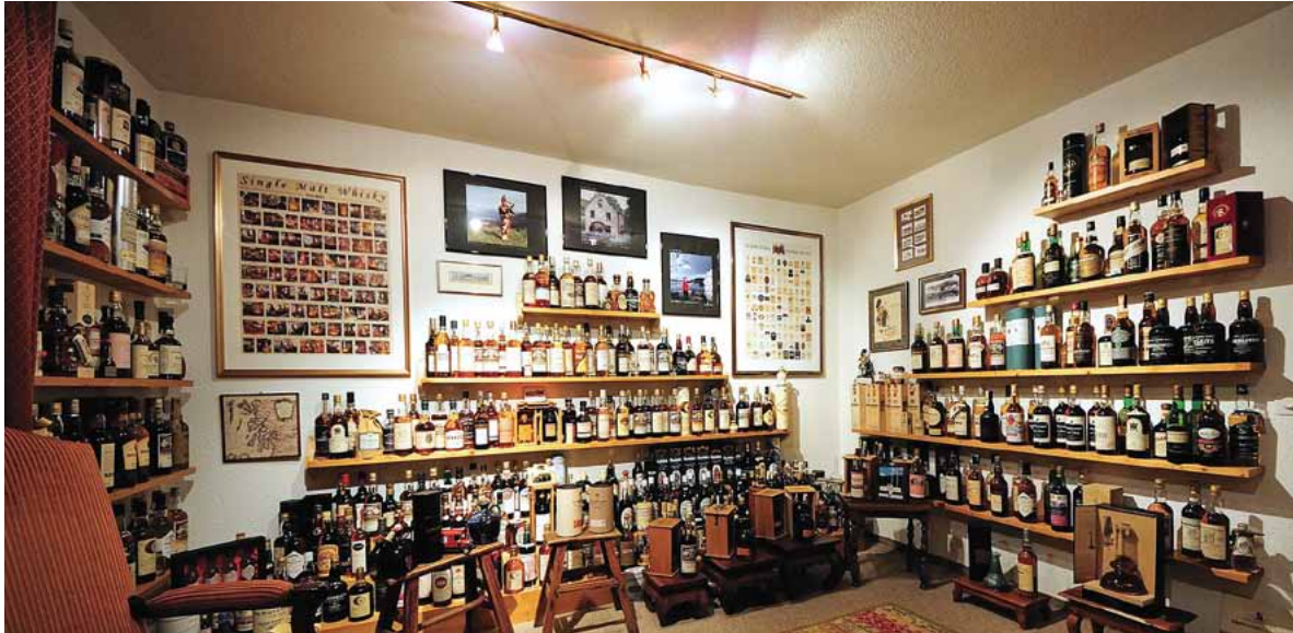
Ein Eldorado für den Whisky-Connoisseur und -Liebhaber: Wände und Regale mit vielen und raren Whisky-Flaschen gefüllt.