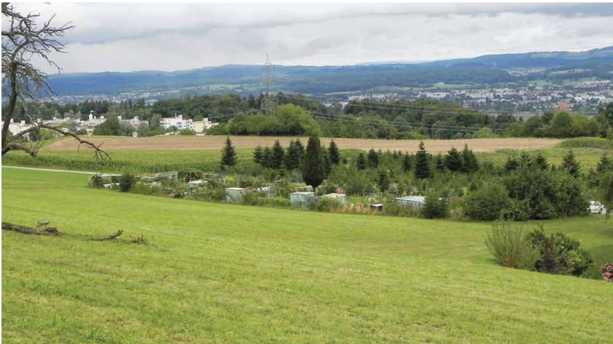
Hier kommt der neue Spielplatz hin.