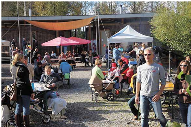
Feststimmung in der Naturstation Silberweide.

Am Wochenende vom 22./23. August feiert die Naturstation Silberweide ihr 10-Jahr-Jubiläum mit einem grossen Sommerfest. Ein Programm, das die ganze Familie unterhält, wartet auf alle Naturfreunde. Von der Führung bis zur Experimenten-Werkstatt für Kinder ist alles dabei!