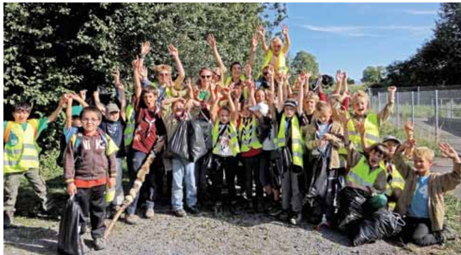
Juhui, wir hatten einen tollen Nachmittag!

Nun wurden die Kinder in zwei Gruppen aufgeteilt. Ein Teil der Butzlis wurde mit den Autos an den Startpunkt zur Jugendherberge Fällanden gebracht und die zweite Gruppe zur Badi Egg. Während wir noch auf die