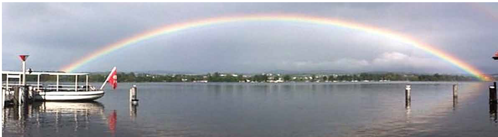
Regenbogen auf dem Greifensee: Schlagen Sie den Bogen für Ihr nächstes Fest zur SGG.

Der Gedanke, ein Schiff zu mieten, ist aufgrund falscher preislicher Vorstellungen oft ein Gedanke, den man gar nicht in Betracht zieht, wenn ein Firmen- oder Familienfest ansteht. Die Schifffahrts-Genossenschaft Greifensee (SGG) in Maur zeigt sich innovativ und geschäftstüchtig und informiert über die Möglichkeiten einer Schiffsmiete für Feste, Feiern und unvergessliche Momente.