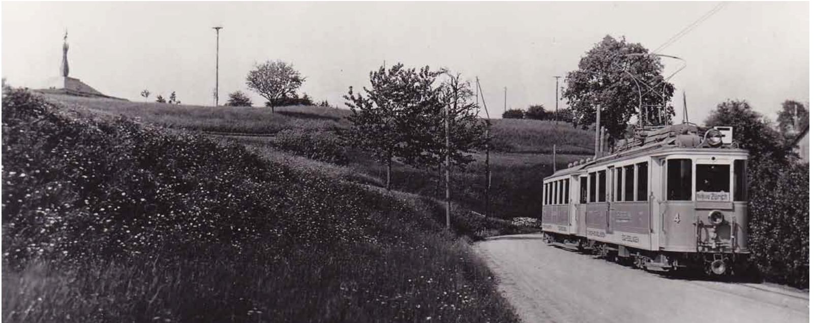
Der älteste, noch in Betrieb stehende Triebwagen aus dem Jahre 1912.

Zwei Bahnen standen sich in Konkurrenz, Anfang des 20. Jahrhunderts, gegenüber. Die eine auf dem Berg führte über die Forch und die andere im Tal von Oerlikon nach Uessikon. Die Bahn entlang des Greifensees versprach wirtschaftlichen Aufschwung, doch das Projekt scheiterte an den Finanzen.