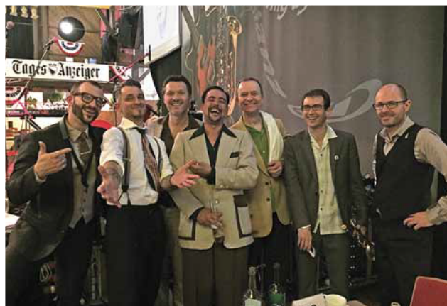
«The Primatics» bei ihrem diesjährigen Auftritt im Albisgütli.

Am diesjährigen JazzAscona, welches am 4. Juli endete, gewann die Band «The Primatics» den Publikumspreis «My Choice». Die damit ausgezeichnete französische Band wird am 15. August auch in Greifensee, anlässlich des Festivals «Jazz am See», auftreten.