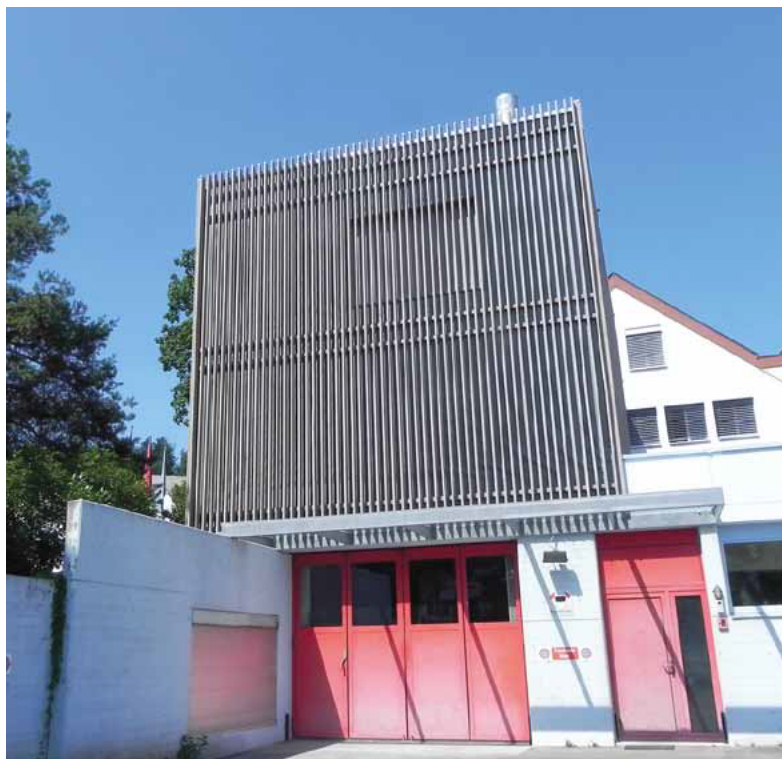
Sozialamt Maur: Entscheidende Frage nicht gestellt?

Bei jedem Gesuch um Ausrichtung von Sozialhilfe haben die Klienten detailliert über ihre wirtschaftliche Situation Auskunft zu erteilen. Im vorliegenden Fall konnte jedoch aus Sicht des Gerichts nicht genügend dokumentiert werden, dass der fragliche Klient die Sozialbehörde aktiv irreführt hatte. Die Staatsanwaltschaft hatte die Beweislage anders eingeschätzt und dem Gericht eine Freiheitsstrafe von acht Monaten beantragt.