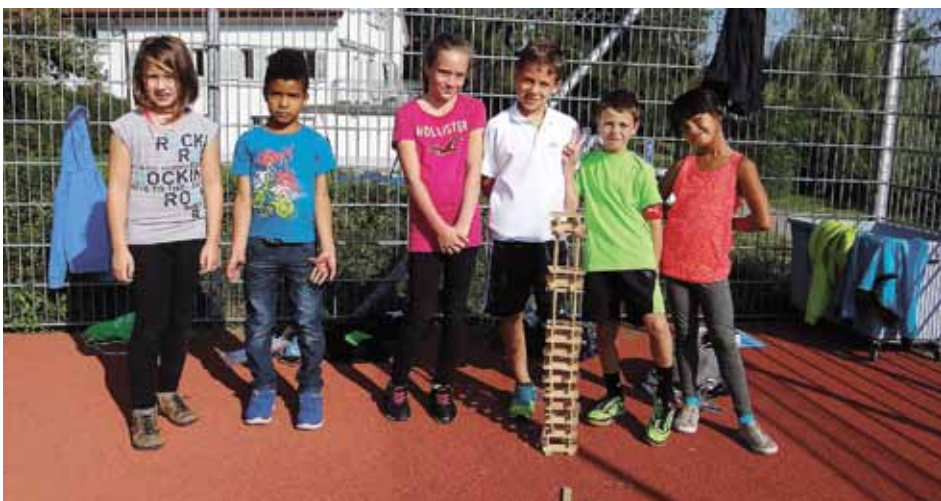
Wir mussten viel hin- und herrennen, um diesen tollen Turm zu bauen.