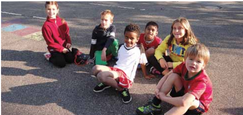
Wir haben gerade viele Nüsse getroffen, das war lustig!