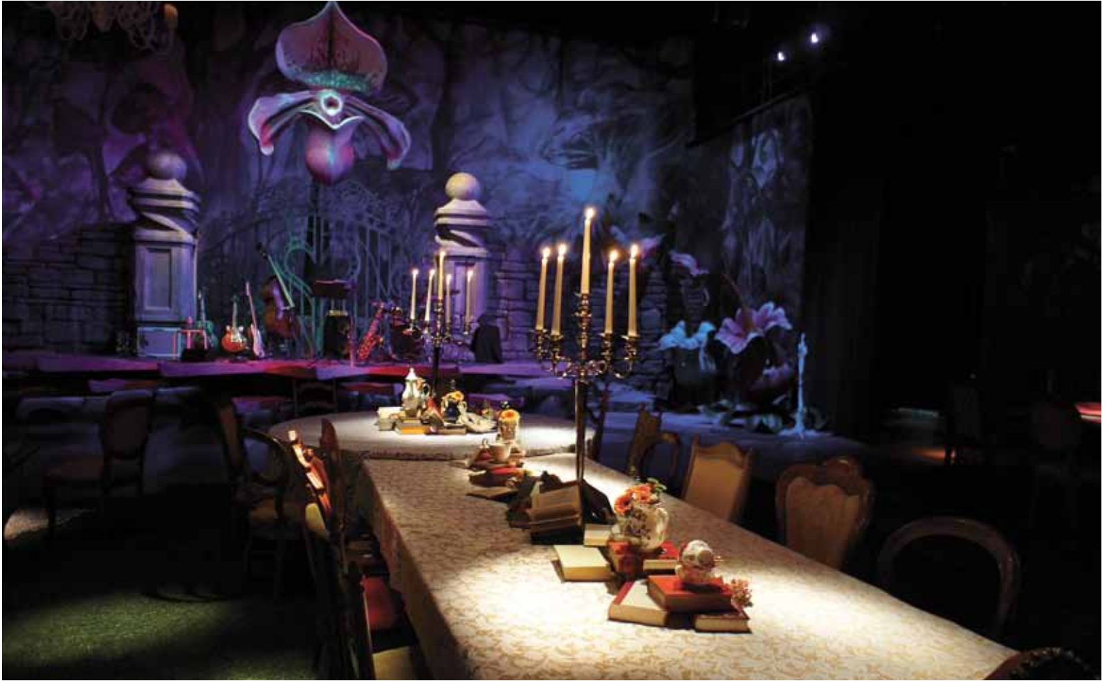
Stimmungsvolles Ambiente im ehemaligen Studio Maur.

An der Maurmer Badanstaltstrasse befindet sich nicht nur die namensgebende Badi, sondern auch eine eigentliche Traumfabrik. Seit 13 Jahren entstehen im ehemaligen Studio Maur Fantasiewelten in und ausserhalb der Gebäulichkeit. Verkaufsleiter und Administrator Angelo Fiore öffnet der «Maurmer Post» die Tore in eine bizarre-skurrile Landschaft.