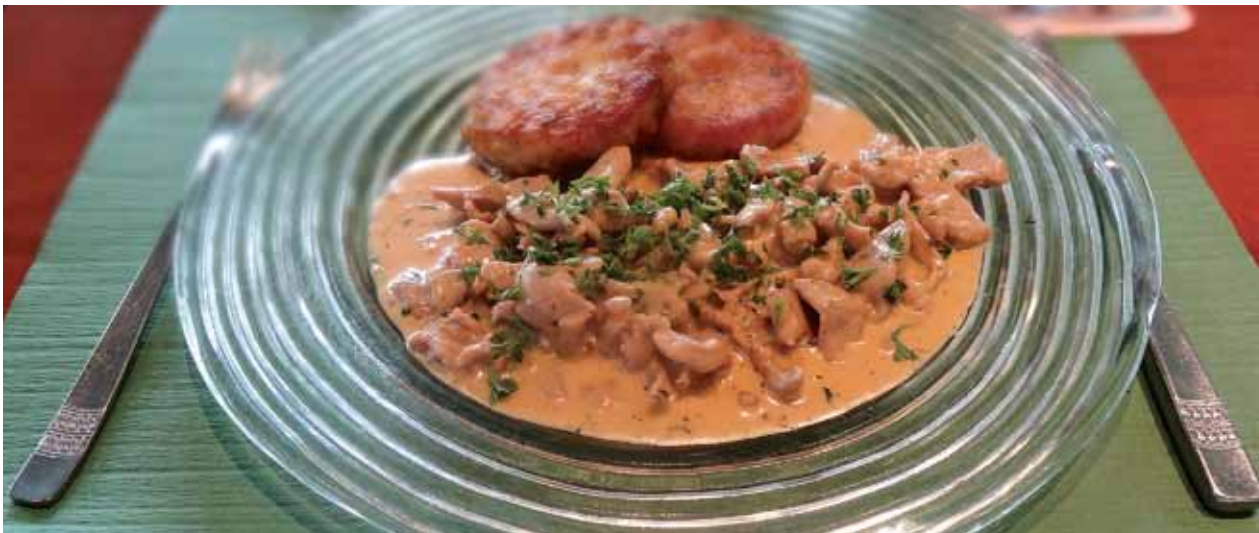
Delikates und feines Züri-Geschnetzeltes im Bistro Schützenwis.

Seit geraumer Zeit haben sich die Gasthäuser unserer Region etabliert und gefestigt. Nun mischt der Wechsel des Betreibers im Café-Bar Bistro Schützenwis an der Schützenwisstrasse – vis-à-vis der Maurmer Gemeindeverwaltung – die Restaurantlandschaft etwas auf.