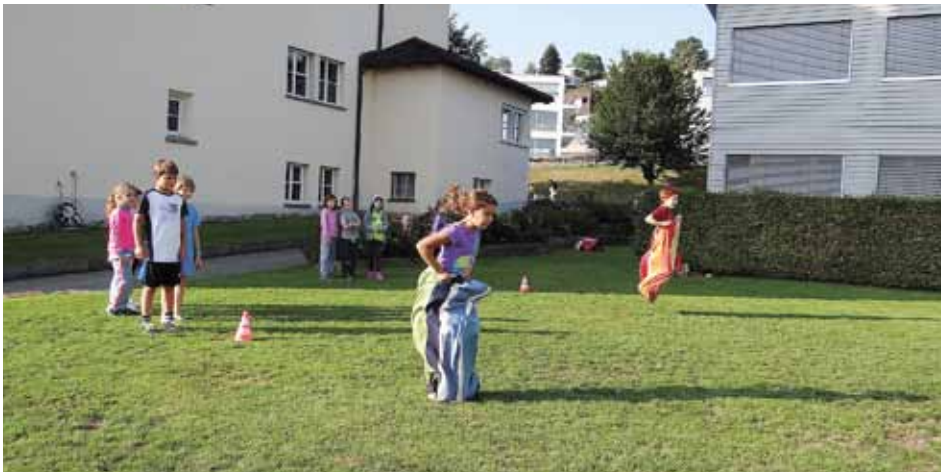
Uiii, ich kann mit dem Sack ja auch hoch springen!