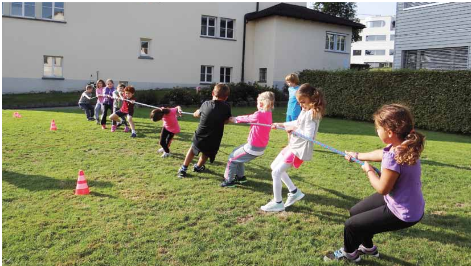
Ziehen, ziehen und noch mehr! Tja, gewonnen haben meistens dieselben.

Die Maurmer Kinder durften sich auf einen abwechslungsreichen Sportmorgen freuen. So erwarteten sie die unterschiedlichsten Herausforderungen wie eine Becherstafette, Boccia spielen, Nüsse knacken oder einen hohen Turm bauen und immer wieder rennen, rennen.