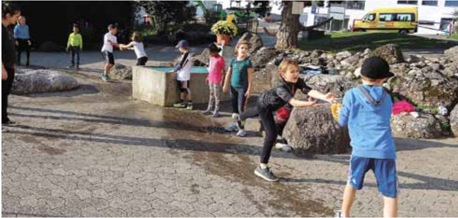
Schnell, gib den Schwamm weiter!