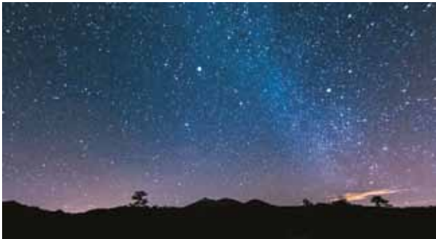
Farben der Nacht.

Welche Farbe hat die Nacht – was würden Sie sagen? Jede Zeit trägt ein eigenes Stimmungsbild. Die Nacht und ihre Farben werden in der Musik einzufangen versucht, etwa in den «Nocturnes» von Chopin. Und im Kirchengesangbuch finden sich wunderbare