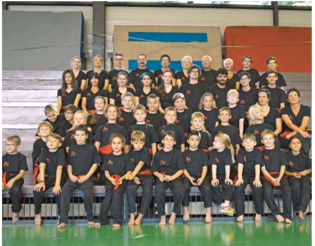
Die Kids der Karateschulen Kilchberg und Maur.