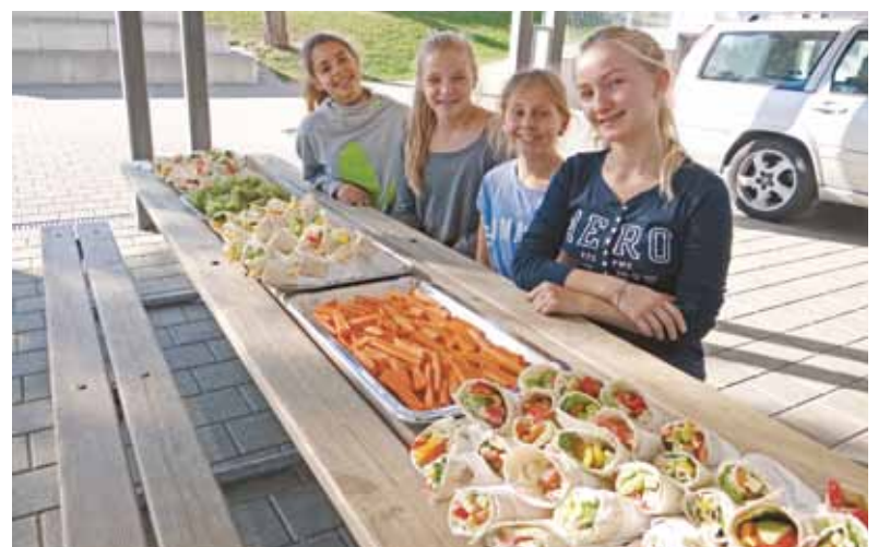
Jetzt können die anderen Kinder ihren Znüni holen kommen.