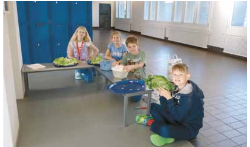
Den Salat zu waschen, ist aber eine ziemliche Arbeit.