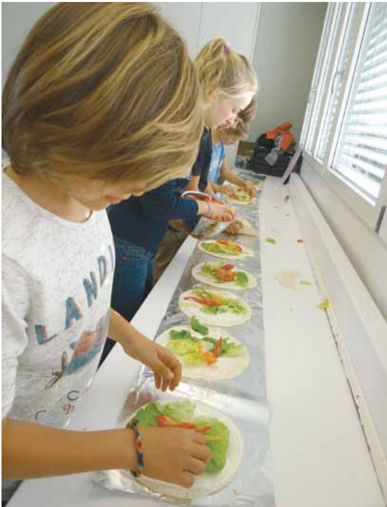
Hier ist Teamwork gefragt, überall kommt dieselbe Füllung rein.