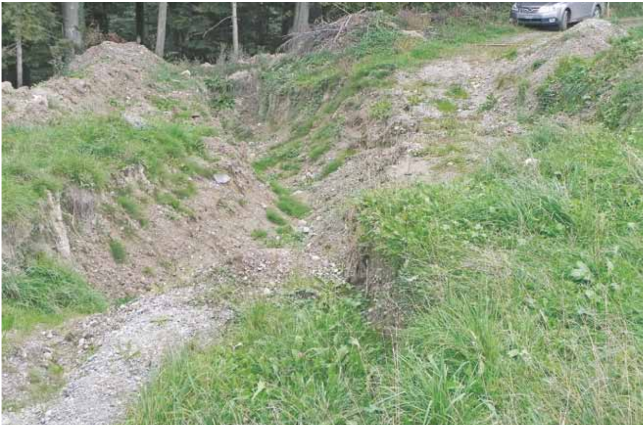
Rutschgefährdetes Gebiet: Flurweg und Hang entlang dem Zollinger-Arm.

Der Flurweg in der Nähe der Verzweigung Eichgubelt/Tobelstrasse in Aesch endet plötzlich im Nichts. Auf einer Gesamtfläche von ca. 400 m 2 und einer Länge von ca. 50 m klafft eine grosse Verwerfung, und behelfsmässig führt ein Trampelpfad für die Fussgänger und die Landwirtschaft an der äusseren Kante des Abrisses entlang. Fussgänger mögen sich fragen, ob da Erdbewegungsarbeiten im Gang sind. Tiefbauvorstand Thomas Frauenfelder erklärt aber im Beisein von Förster Urs Kunz und Beat Fenner von der Maurmer Unterhaltsgenossenschaft, dass es ein Hangrutsch sei, welcher in dieser Grössenordnung in Maur gemäss ihrer Erinnerung noch nicht vorgekommen sei. Das Gebiet mit seinen reichlichen Wasservorkommnissen ist aber gemäss Geologen rutschgefährdet. Da es