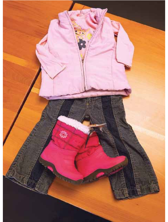
Outfit für ein Mädchen mit tollen Stiefeln: alles zusammen nur Fr. 13.–.

Der Aufwand ist gross, die Einnahmen einiges kleiner. Dank dem Einsatz des Ortsvereins Binz-Ebmatingen und einigen Helferinnen kann man Kinder topmodisch einkleiden. Und dies zu einem sensationellen Preis.