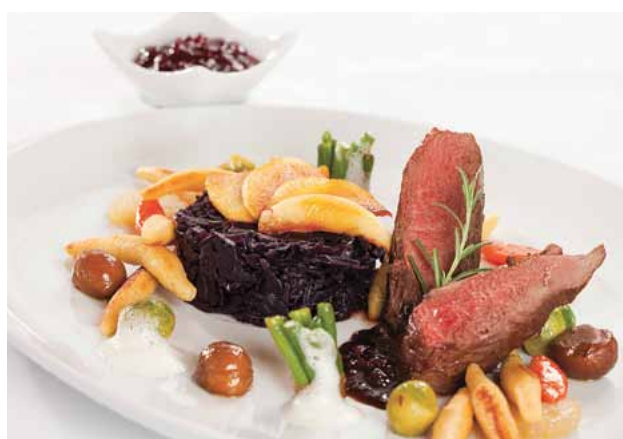
Wildgericht mit Rotkraut, Fingernudeln und Marroni.