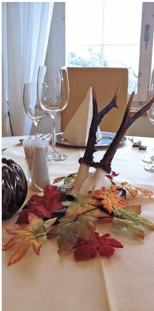
Der Tisch ist für die Wildspezialitäten gedeckt.