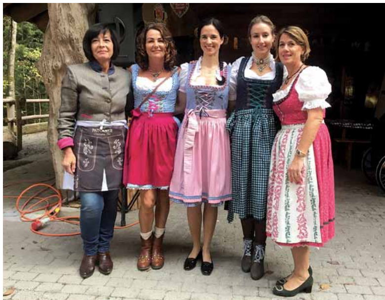
Schöner als in München: Die Feen des Maurmer Oktoberfests.