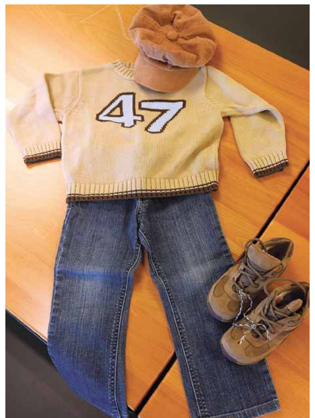
Der Bub mit modischem Pullover, Jeans und lustiger Mütze: Fr. 14.– total.

Also, liebe Väter: Bei der nächsten Kinderkleiderbörse der Mutter eine Ruhepause gönnen am Samstagmorgen und in der Börse die Kinder modisch einkleiden. Das nennt sich auch «Shopping für Männer» und erst noch eine Menge Geld gespart.