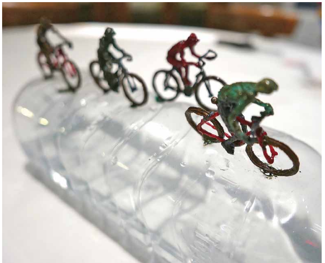
Von Künstler Martin Schmid erstellt: Radfahrer auf PET-Flasche.