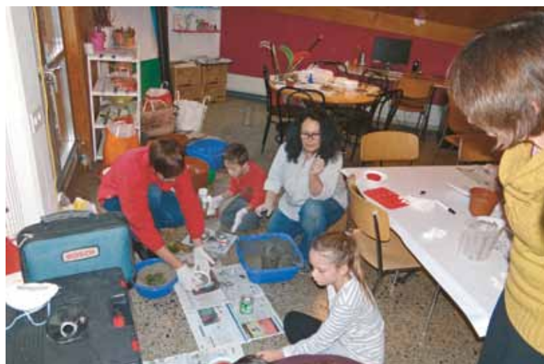
Jetzt wird ausgegossen.