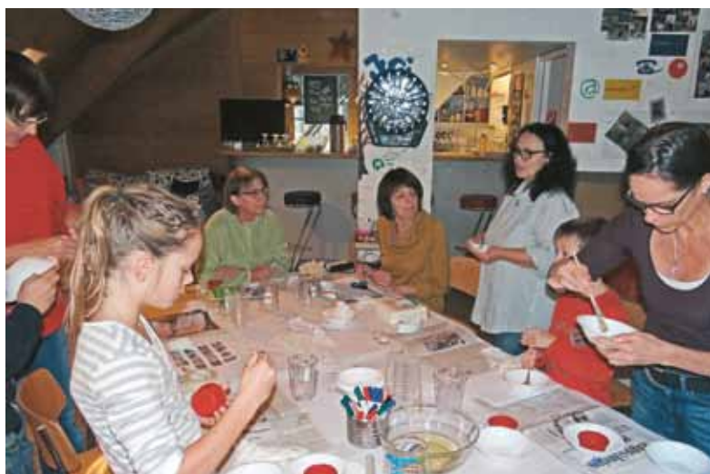
Das Bepinseln mit Öl ist sehr wichtig.

Güzelen im Jugendhaus Samstag, 5. Dezember 2015, von 14.00 bis 18.00 Uhr, Fr. 5.- / Pers. Anmelden unter: offene.jugendarbeit@maur.ch Jugend- und Freizeithaus Maur, Looren Forch