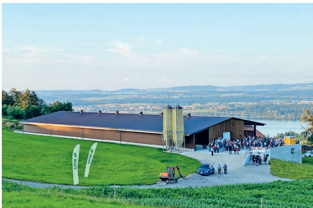
Das neu gebaute, doppelstöckige Betriebsgebäude mit einer Aufzuchtstation für bis zu 18000 Legehennen. Der Hof befindet sich unterhalb der Looren mit schönster Aussicht auf den Greifensee.

«Ich bin Unternehmerin, lernfreudig, naturverbunden, interessiert an neuen Lebensideen und versuche, bewusst ökologisch, wertschätzend und ökonomisch zu leben. Sportlich wäre ich gerne aktiver.»