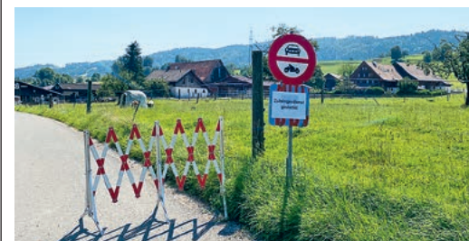
Aktuell gesperrte Neuguetstrasse.

Die Anordnung an der Neuguetstrasse ist allerdings auch nur temporär: Wie die Gemeinde Maur meldet, machen Bauarbeiten, die noch bis 18. Januar 2022 dauern sollen, die vorübergehende Sperrung für den Durchgangsverkehr nötig. Die Gemeinde Maur kann solche temporären Verfügungen in eigener Kompetenz für bis zu sechs Monate erlassen.