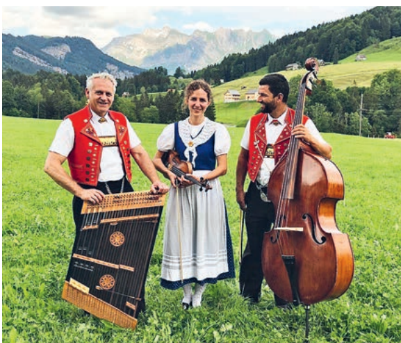
Sorgen für Unterhaltung – Ländlertrio «Rond om de Säntis».

Bald geht's los! Die Schule fängt wieder an. Für die reformierten Zweitklässler*innen beginnt damit der kirchliche Unterricht. So ein Start ist etwas Besonderes. Darum begrüssen und segnen wir die «minichile» Kinder im Gottesdienst. Und quasi zu ihren Ehren führen die Kinder der Singwoche das Minimusical «Noah» auf, eine