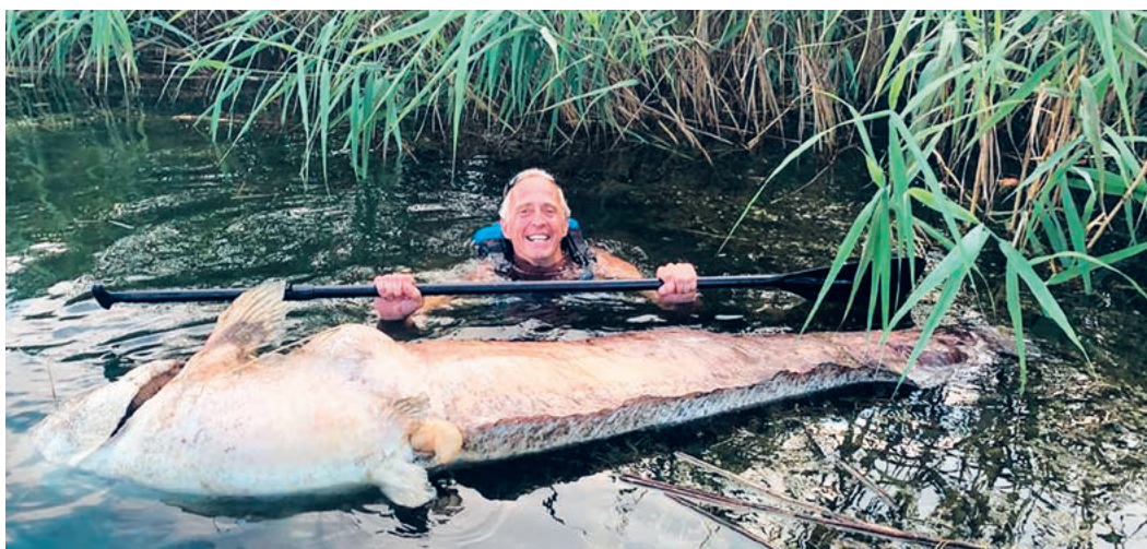
Vermutlich ist der Monster-Wels um die 30 Jahre alt geworden.