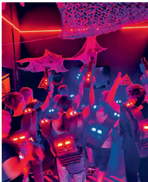
Laser-Tag: Actiongame für Adrenalin-kids.

Die Fundstelle liegt laut Blick zwischen Camping Rausenbach und dem Naturfreunde-Zeltplatz. Zwischenzeitlich ist das tote und immer strenger riechende Tier von der Polizei mit einem Motorboot nach Uster abtransportiert worden und wurde von da zu einer Kadaverstelle gebracht.