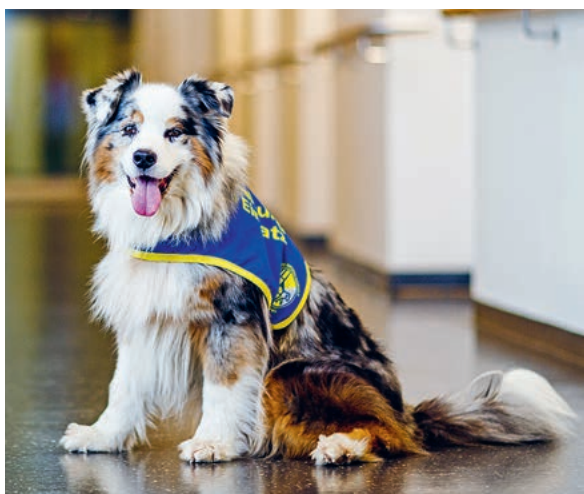
Darf gestreichelt werden – Sozialhund Chico.