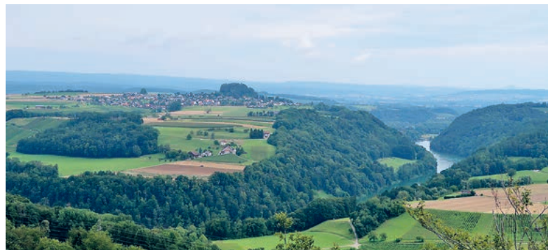
Rundblick vom Aussichtsturm Petersboden.

Kosten: Bahn/Bus, Unkostenbeitrag HAT Fr. 18.00, GA Fr. 7.00