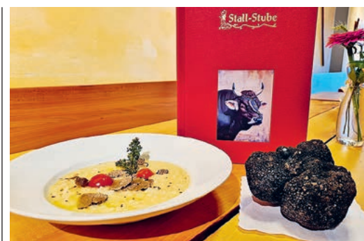
Trüffelrisotto und Rekordtrüffel.