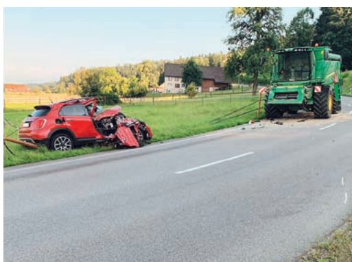
Totalschaden am Auto.

Die Lenkerin zog sich leichte Verletzungen zu, ihr Auto erlitt einen Totalschaden. Beim Mähdrescher, einem Zaun und an der Strasseneinrichtung entstand Sachschaden in der Höhe von mehreren tausend Franken. Die Rällikerstrasse wurde für zwei Stunden gesperrt.