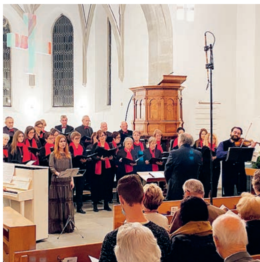
Die Kirche Maur war fast bis auf den letzten Platz gefüllt.