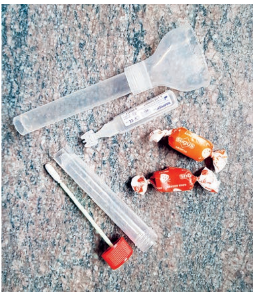
Schulleiter Serge Künzler (Bild oben) ist zuständig für die Corona-Tests an der Schule Maur. Im Bild unten: Test-Utensilien und die süsse Belohnung für die Schulkinder.