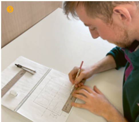
Nicola sucht die besten Lösungen zur Umsetzung