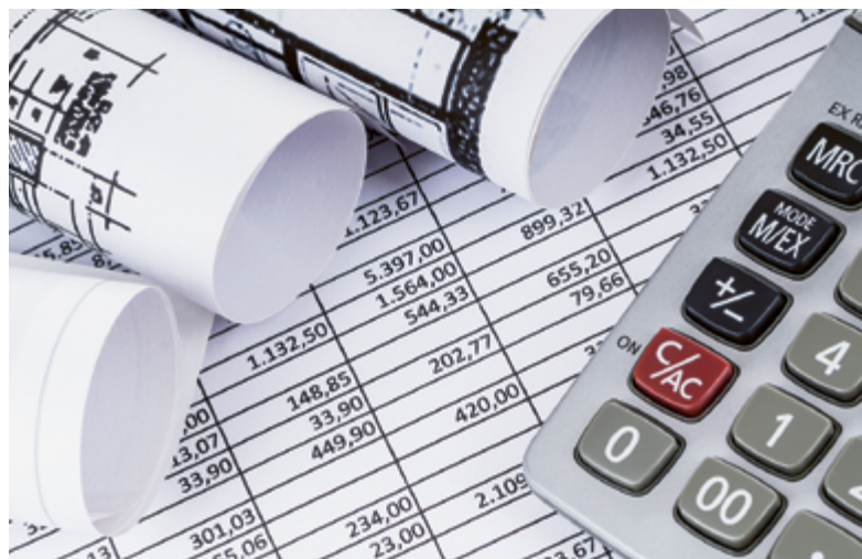
Bauen – oft komplexer und kostspieliger als angenommen.

Der von der Stiftung beauftragte Bauherrenberater zeigte Bedauern. Die Prognose sei schwierig gewesen. Der Stiftungsrat liess verlauten, die Differenz zwischen den prognostizierten und den tatsächlichen Kosten sei der «grossen Komplexität des Bauvorhabens» zuzuschreiben. Man wolle aber Lehren aus dem Ganzen ziehen: