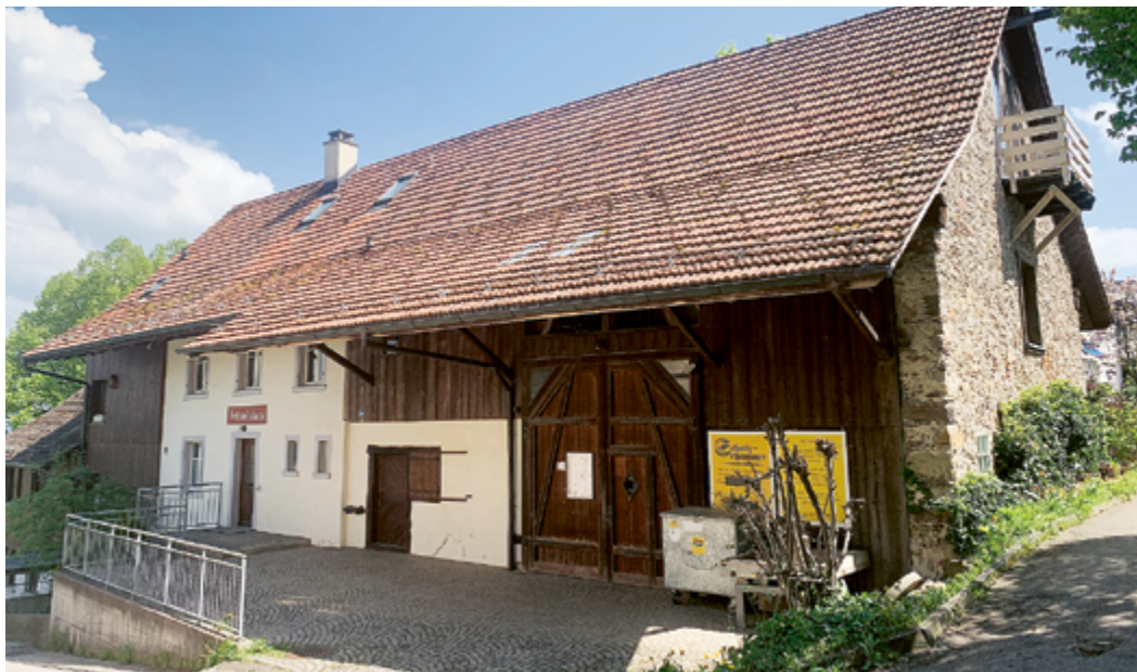
Beherbeget kleine und grosse Schätze: das Wettsteinhaus mit Schatzhammer-Brocki.