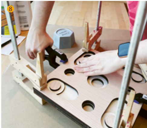
Holzplatten zusammenleimen und fixieren