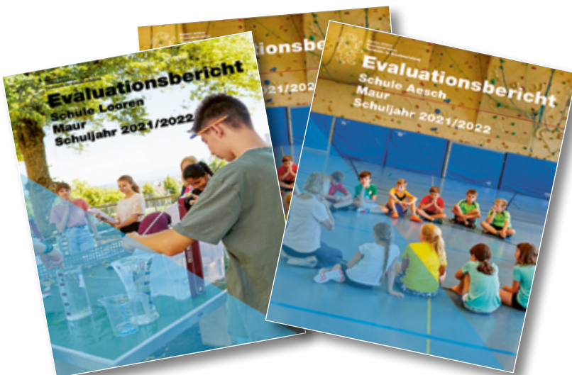
Die Evaluationen der Fachstelle sind öffentlich einsehbar.

Wenn man sich die Mühe macht und die einzelnen Überblicke der evaluierten Qualitätsansprüche aus den je zwischen 65 und 73 Seiten starken PDFs (pro Schuleinheit!) herausfiltert, kommt man zu einem etwas anderen Bild. Die Überblicke sind nach den unter-