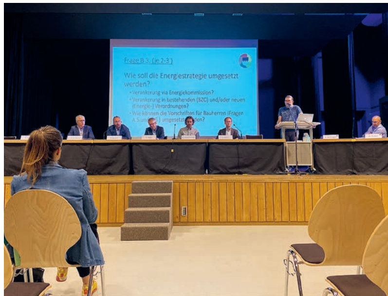
Den Anwesenden wurde das Energieleitbild vorgestellt.

Es folgten dabei Voten, die manchmal der persönlichen, oft