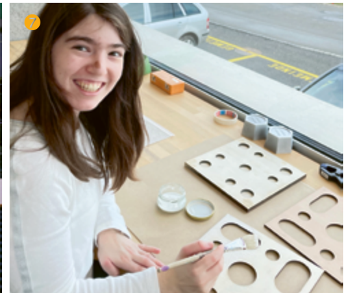
Gulia klebt die verschiedenen Holzplatten zusammen