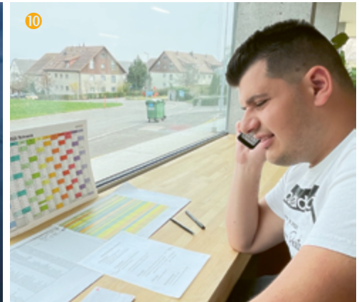
Marko akquiriert mit Freude Neukunden

chen oder Frauchen? Diverse Testpersonen erstellen Videos ihres Hundes, während er sich mit den Spielen vergnügt und schliesslich wird «Zuma» ausgewählt (Bild 1) – sie repräsentiert am Besten, wie «Hund» damit umgeht. Dazu muss man wissen, dass jeweils unter den Schiebern oder Zapfen der Spiele kleine Belohnungen in Form von Goodies versteckt sind, welche den Hund natürlich enorm motivieren, sich an die Arbeit zu machen!