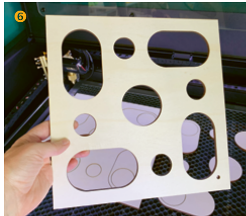
Wichtig: bissfestes Holz