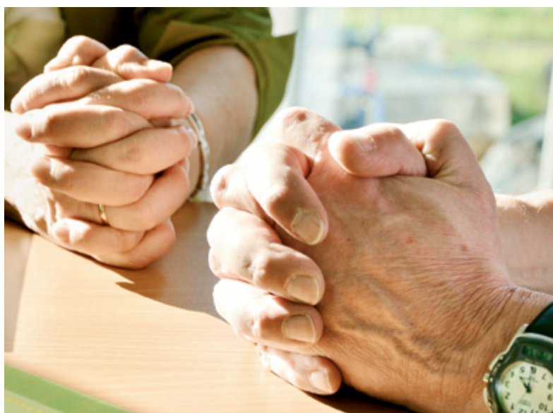
Foto: Betende Hände