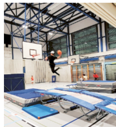
Sport at Night

ist etwas dabei. Die nächste Sport at Night findet am Samstag, 14. Mai 2022, statt. Weitere Daten werden im Veranstaltungskalender der «Maurmer Post» publiziert.