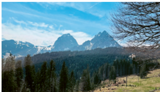
Der Grosse und der Kleine Mythen.