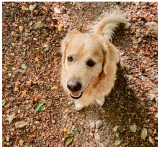
Neu müssen Hunde jeweils zwischen 1. April und 31. Juli im Wald und am Waldrand an die Leine genommen werden.