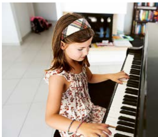
Klavierspielen – vielleicht auch etwas für Ihr Kind?

Am 1. April 2023 führt die Musikschule Maur ihren traditionellen Informationsanlass durch. Wie hört sich eine Violine an, wie bläst man einen schönen Ton auf der Trompete oder dem Saxofon? Wie startet man am Schlagzeug? Haben Ihr Kind oder Sie eine besondere Vorliebe für ein Instrument?