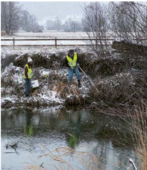
Normalerweise gesperrt: das Ried.