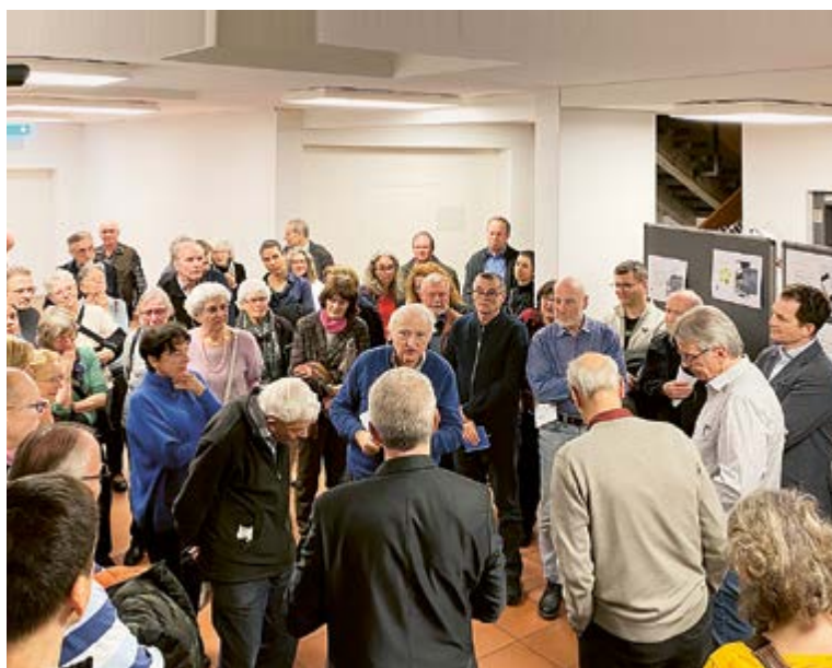
Emotionale Diskussionen zur «Maurmer Post».