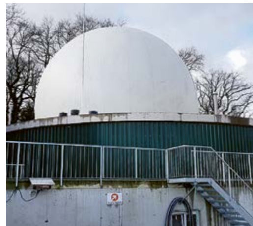
Eine Biogasanlage vergärt tierische Exkrememente (z. B. Gülle) und Pflanzen, um Gas zu erzeugen.