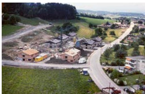
So sah die Umgebung des Gemeindehauses 1978 noch aus (Bild oben). Auf den Bildern unten ist die Leeacherstrasse in Ebmatingen zu sehen (links, ebenfalls 1978) und die Kreuzung in Binz 2007.