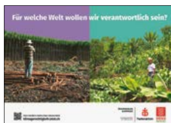
Klimagerechtigkeit – jetzt!