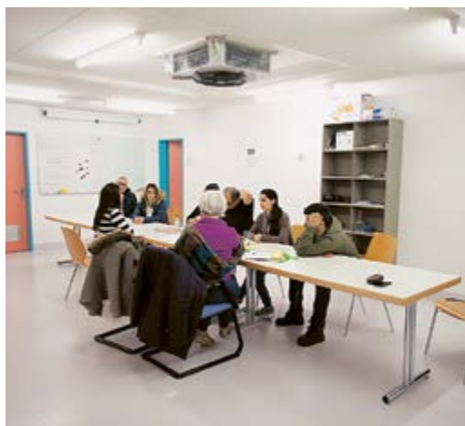
Impressionen von der Unterbringung von Flüchtlingen in der Maurmer Zivilschutzanlage, Bilder vom März 2016.