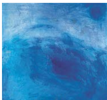
Eines der Werke.

Die Bewohner der Gemeinde Maur und ihre Freunde sind dazu herzlich eingeladen.