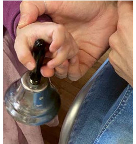
Abwechslungsreiche Spiele für Kleinkinder.

Eine wunderbare Sache, die Raum für Ideen gibt, wie man den Nachwuchs abseits von digitaler Berieselung sinnvoll beschäftigen kann. Die Daten finden sich immer in unserem Veranstaltungskalender auf der letzten Seite der MP oder online auf www.maur.ch .