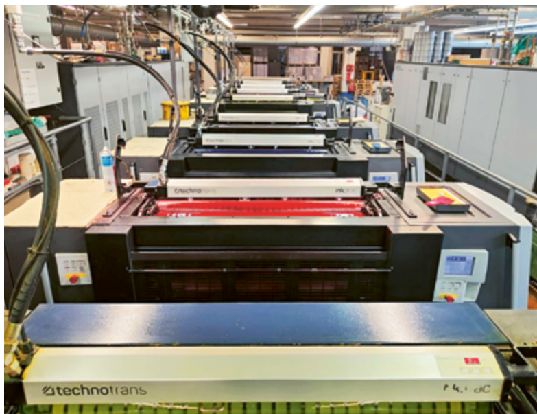
Aufwendige Produktion: Eine Druckmaschine kostet mehrere Millionen Franken.