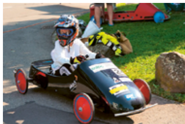
Keiner zu klein, ein tollkühner Pilot zu sein.

Achtung, fertig, los! Die Maurmer Rennszene schaut weder nach Monaco noch nach Indianapolis. Ihr grosses Highlight steigt am 1. Juli vor der eigenen Haustür – mit dem Seifenkistenklassiker am Wassberg.