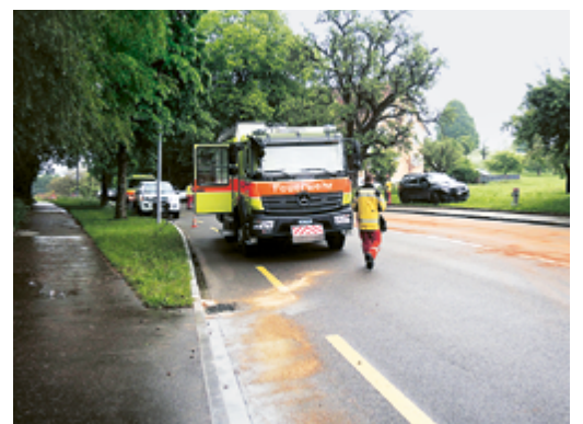
Reinigungsarbeiten: die Feuerwehr Maur im Einsatz.