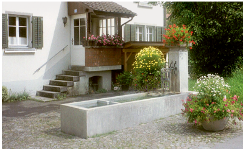
Eine Wasserquelle von kulturhistorischen Dimensionen: der Kirchbrunnen.

Am 21. August 1847 hat sich die Kirchbrunnengenossenschaft gegründet. Der Laufbrunnen an der Eggstrasse in Maur lieferte seit seiner Errichtung Trinkwasser für die umliegenden Haushalte, die bis 1911 noch nicht über fliessendes Wasser verfügten. Er diente ausserdem als Viehtränke und hatte früher einen Waschtrog im Anschluss an das vordere Becken, wo man Wäsche wusch. 1936 mussten der Sandsteintrog und der Brunnenstock ersetzt werden, original wie bei seinem Bau ist bis heute nur noch der Hut aus Sandstein. Im Laufe der Jahre fiel auch die Nutzung fürs Vieh weg, 1960 drohte dem Brunnen dann erstmals das Aus. Es gab nur noch zwölf Mitglieder in der Genossenschaft, man dachte an Auflösung, der Brunnen sollte an die Politische Gemeinde oder an die Wassergenossenschaft Maur abgetreten werden. Beide hatten jedoch kein Interesse, die Gemeinde rechnete damit, dass der Brunnen sowieso früher oder später beseitigt werden müsse, der Waschtrog