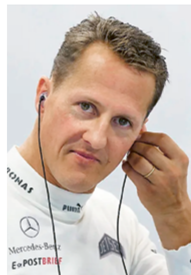
«Fast-Maurmer»: Formel-1-Weltmeister Michael Schumacher.