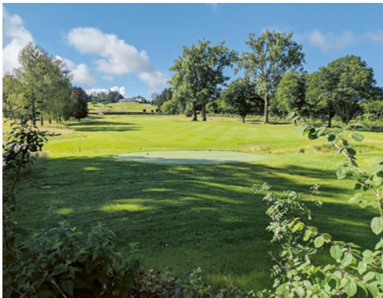
Golf auf sattem Grün: Für dieses Bild muss man in die Nachbarschaft.

Die Gemeinde Maur ist ein beschaulicher Ort. Doch nicht selten wurden hier grosse Pläne geschmiedet. In Uessikon sollte ein Golfplatz entstehen, und Formel-1-Superstar Michael Schumacher wollte die Guldenen kaufen.