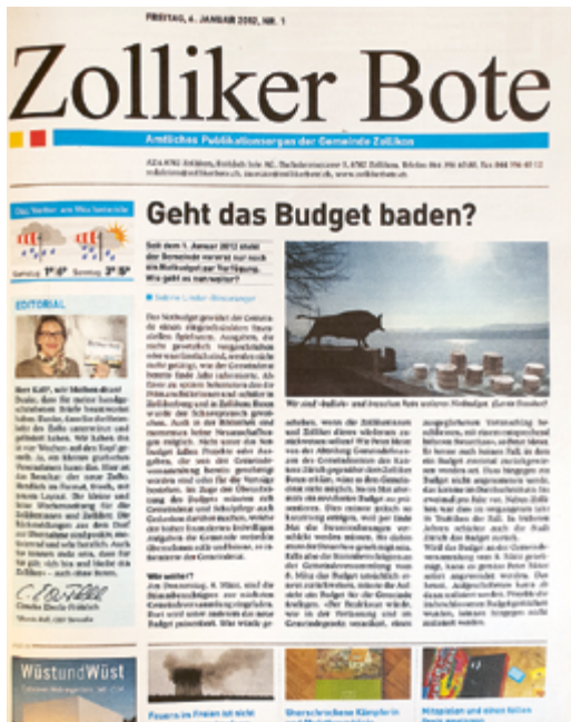
Erscheint die «Maurmer Pos» bald in diesem Verlag?