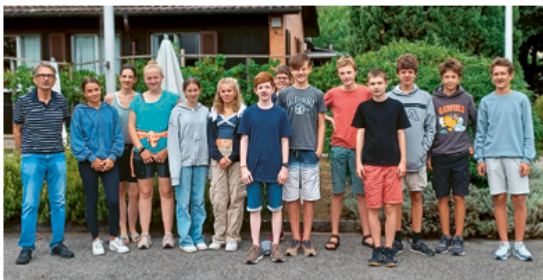
Das Bild entstammt und erinnert an unser Konfirmandenlager im August 2022 in Magliaso. Aber nicht alle, die am 4. Juni konfirmiert werden, sind auf dem Foto abgebildet. Vgl. die untenstehenden Namen! Bild zVg

«Konfirmieren wir die Konfirmanden in die Kirche hinein – oder konfirmieren wir sie aus der Kirche hinaus?» Diese Frage existierte schon zu meiner Konfirmationszeit in den berühmten sechziger Jahren des letzten Jahrhunderts. Obwohl die Frage provoziert und Aufmerksamkeit erheischt, obwohl sie angesichts des Mitgliederschwundes in unseren Landeskirchen auch ihre Berechtigung hat, hielt ich sie und halte sie noch immer für etwas narzisstisch. Sie verrät jedenfalls mehr über den, der sie stellt, als über die, die damit angesprochen sein sollen. Aber sie ist mir, wie man merkt, jetzt, wo ich über die Konfirmation etwas schreiben soll, wieder eingefallen. Ich vermute,