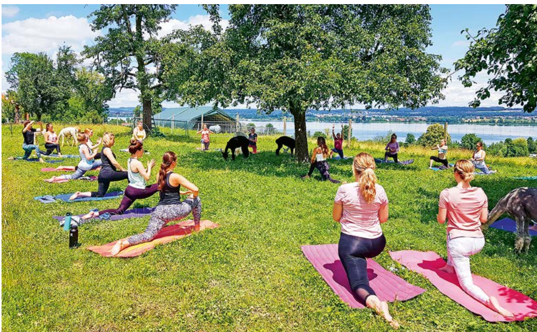
Was wohl die Alpakas denken? Die Yoga-Schülerinnen überzeugen durch Beweglichkeit.