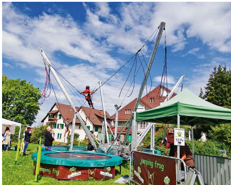
Auch tollkühne Kinder kommen auf ihre Kosten: Am ersten Septemberwochenende kommt auch die Zeit der grossen Mutproben.