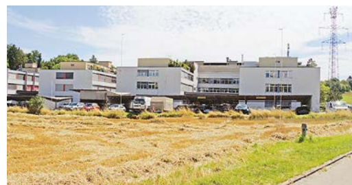
Hier kommen die Wohncontainer zu stehen.