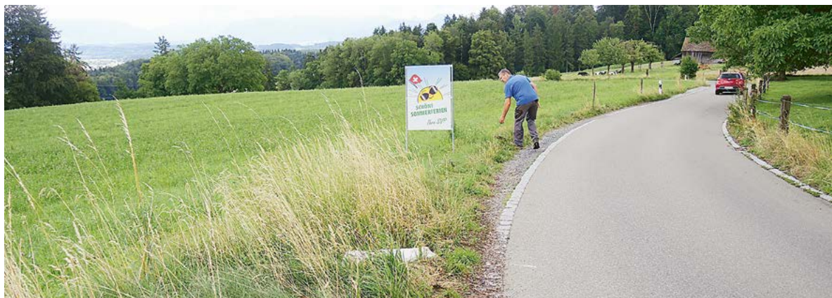
Landwirt Burkhard bei der Schadensbeseitigung an der Hellstrasse.