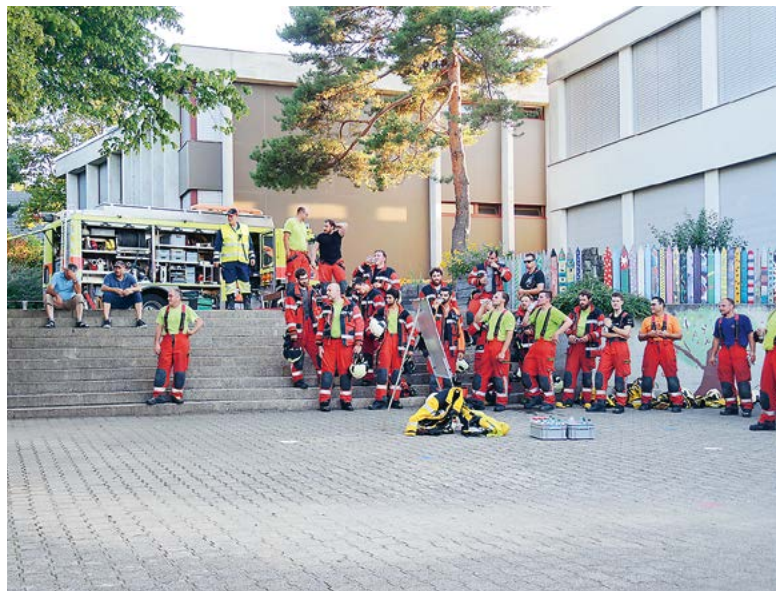
Muss sich auf neue Gefahren vorbereiten: die Maurmer Feuerwehr.