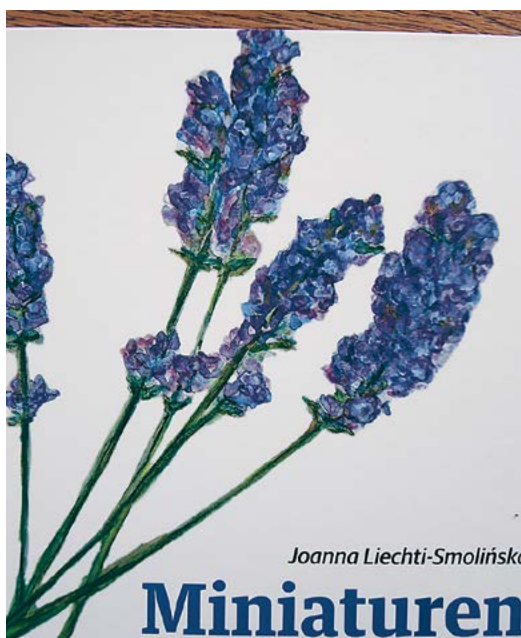
Literatur aus Maur: Blick auf ein langes Leben.