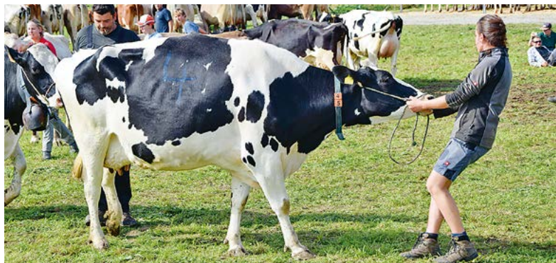
Nicht immer leicht zu bändigen: Kühe entwickeln grosse Kräfte.