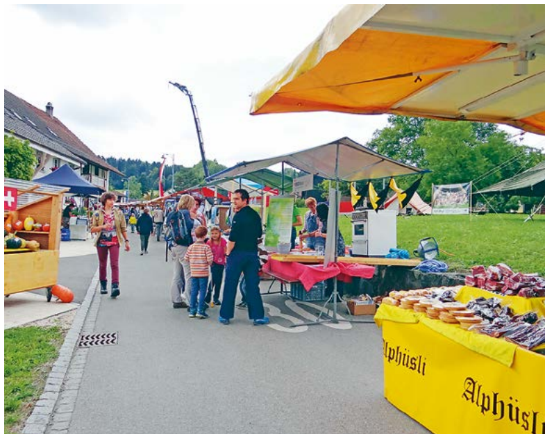
Vom Frauenverein faktisch handverlesen: Die Schausteller und Standbetreiber müssen in Maur gewisse Anforderungen erfüllen. Ramsch ist nicht gefragt.