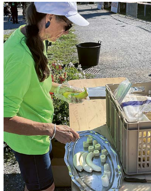
Energieschub: Kiloweise Bananen werden zu Happen geschnitten und an die Läufer gereicht.

Der 44. Greifenseelauf – ein Massenspektakel, bei dem viel Schweiß floss