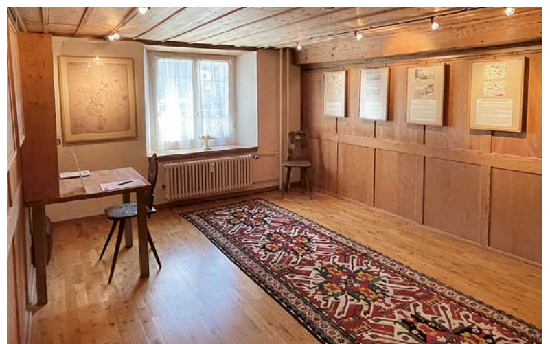
Rahmenprogramm: Informative Tafeln in der Stube.