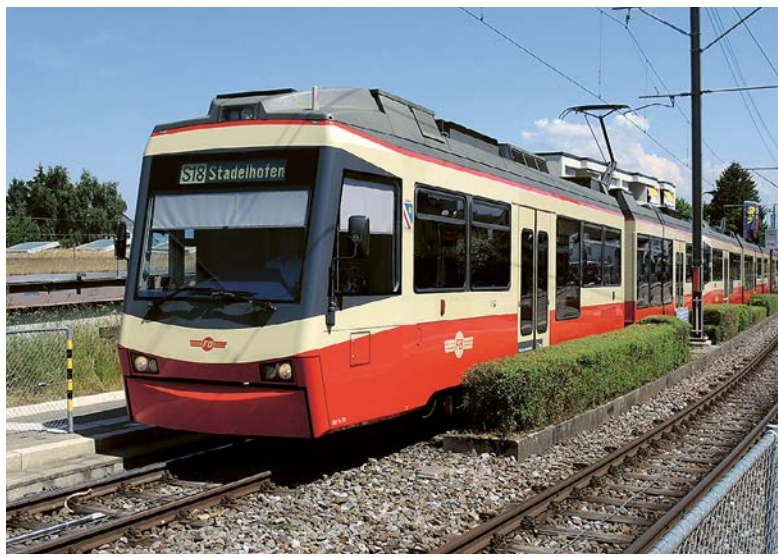
Künftig sicherer unterwegs: die Forchbahn auf dem Weg nach Zürich.

Der Umsetzung des Projekts geht ein jahrelanger rechtlicher Streit voraus. Die Gemeinde Zollikon zog das Verfahren bis vor das Bundesverwaltungsgericht, um die Barrieren zu verhindern. Auch der Quartierverein opponierte – und