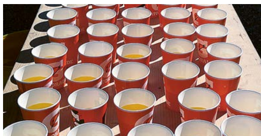
Speicherfüller: Ein Elektrolytgetränk soll den Schwitzenden notwendige Mineralien und Salze zuführen.