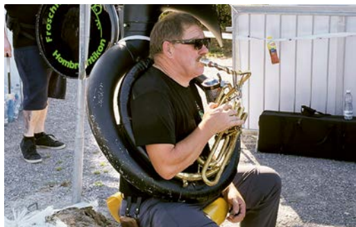
Pacemaker: Ein Guggenmusiker bläst den Marsch..