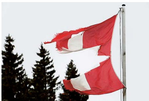
Risse im Schweizer Ideal. Seit der Pandemie wird der Staat hinterfragt.

In Fällanden betont man aber auch, dass es bisher noch nicht zu «gravierenden» Zwischenfällen gekommen ist – und sich der Wi-