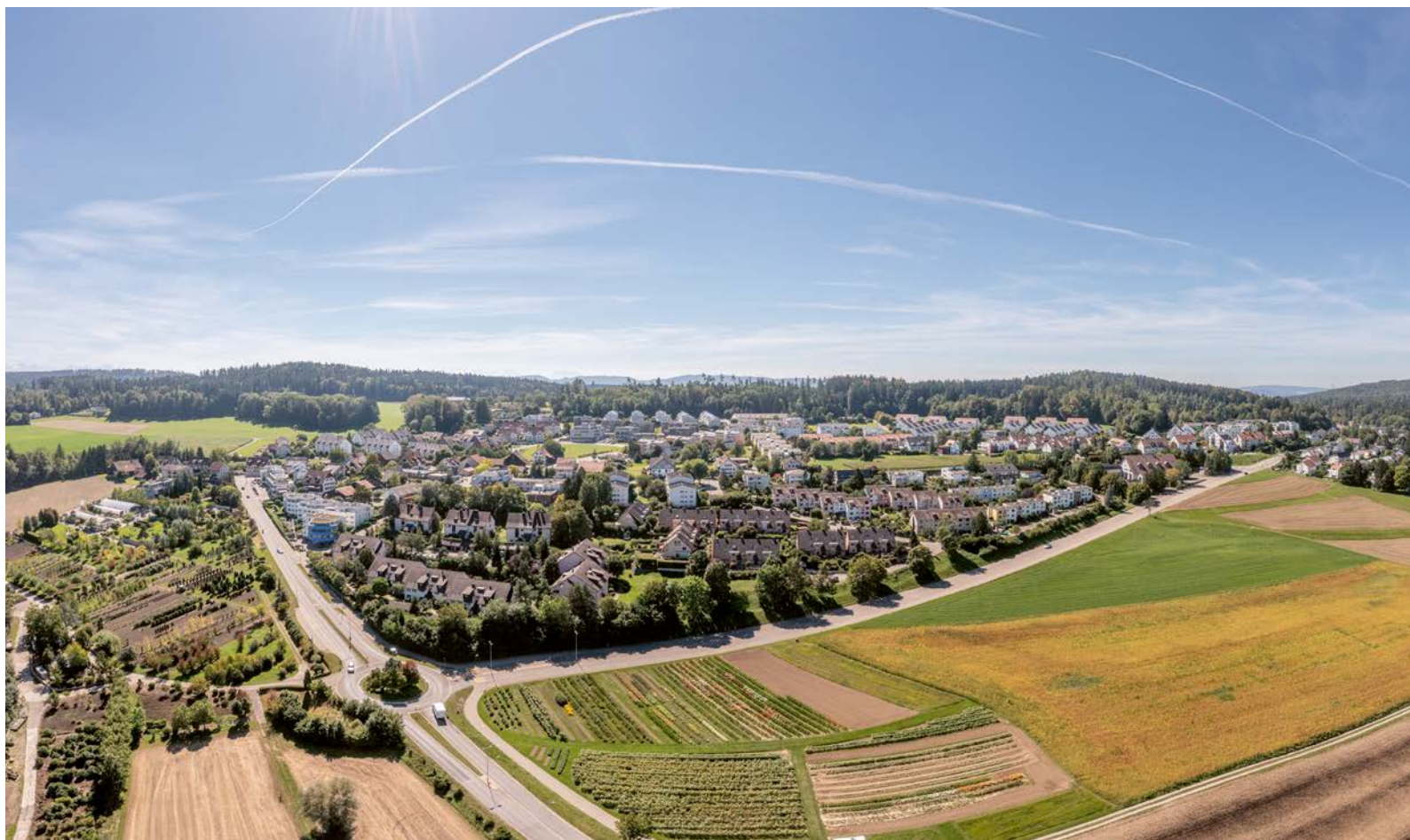
Umgeben von Blumenfeldern und breiten Strassen: In Binz treffen die Gegensätze aufeinander.

über eine breitere Dorfstrasse. Die Champs Élysées, das Reststück einer ursprünglich geplanten Umfahrung direkt nach Ebmatingen, sind Kult – und rufen in Erinnerung: Paris liegt auch in Maur – un petit peu. TRE