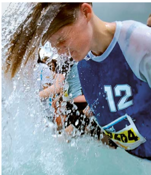
Gute Idee: Wasser belebt die Läuferseele.