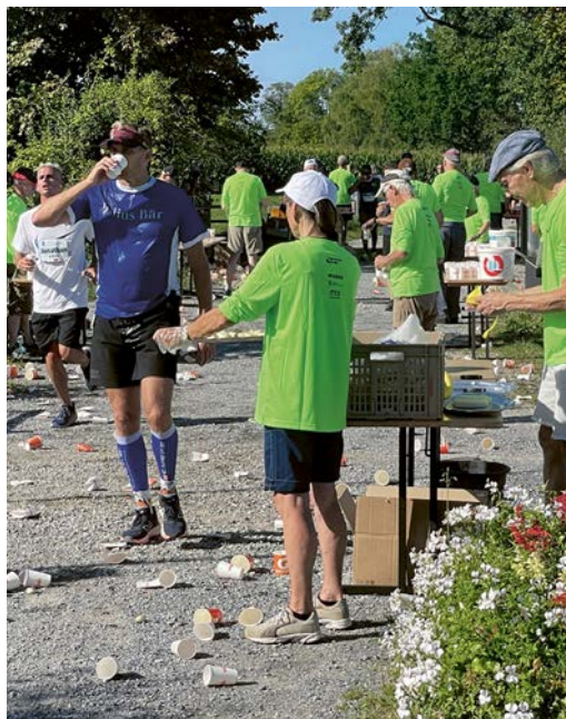
Pufferzone: Am Wasser- und Elektrolytstand kommt der Läuferstrom zeitweilig zum Stoppen.