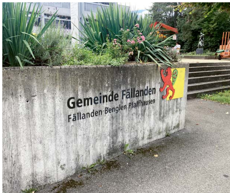
Wer Rechnungen nicht bezahlt, muss früher oder später nach Fällanden.

Diese Erfahrung macht man auch auf dem Betriebsamt Fällanden, Maur, Schwerzenbach. Am Anfang habe man diese Personen für Aussenseiter und Ausnahmen gehalten, mittlerweile hätten sich die Fälle aber gehäuft. Gleichzeitig wollen die Beamten nicht zu offensiv kommunizieren – zu gross ist der Respekt vor Nachahmern und vor einer weiteren Verschärfung der Situation. Die grösste Furcht: Wenn Staatskritiker hören, dass sie nicht