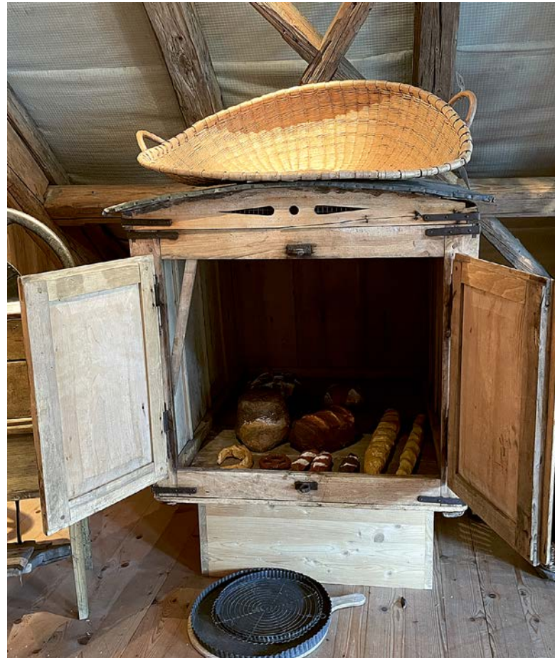
Arbeitszeugnis: Der Brotwagen anno dazumal vom Beck in Maur.

Ein paar Jahre hat es gedauert, auch die Corona-Pandemie und die damit verbundenen Massnahmen waren schuld, dass man nicht