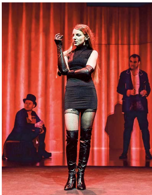
Der Vorhang fällt für das Theater Kanton Zürich.