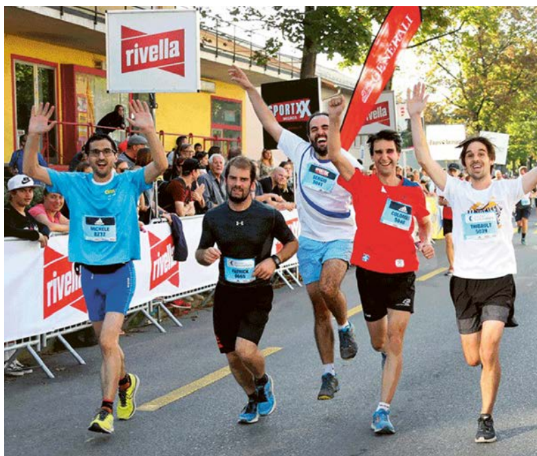
Gute Laune – die Hitze drückt nicht zwingend auf die Stimmung.