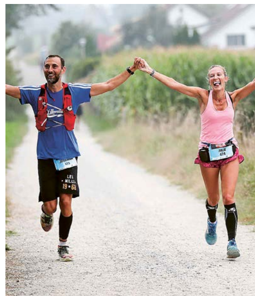
Teamgeist: Zu zweit wird's nicht kühler, aber besser.