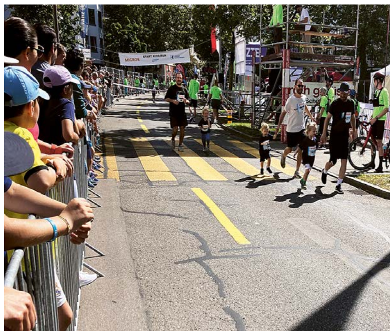
Hand in Hand: Die Jüngsten müssen von ihren Vätern begleitet werden.