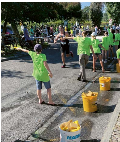
Schwamm drüber: Berge von Nasspendern werden von den Helfern an die Läufer verteilt.