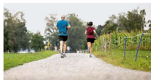
Nachzügler: Für die Letzten dauert der Lauf bis in die Dämmerung. Wie lange, wissen wir nicht.