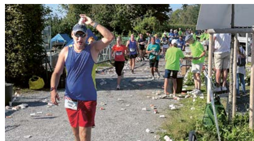
Sofortdusche: Ein Läufer gönnt sich eine Erfrischung.