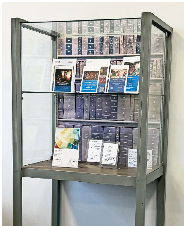
Diese Vitrine soll hübscher werden.