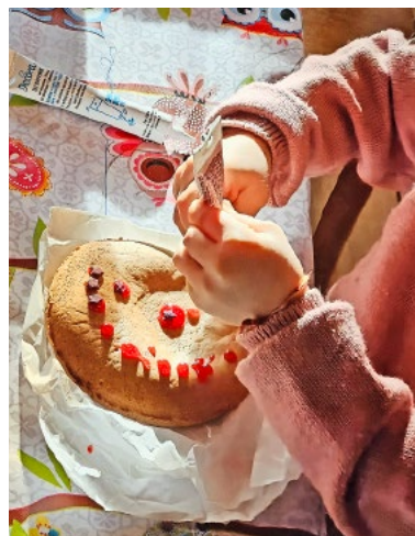
Jetzt wird ein Lebkuchen verziert.