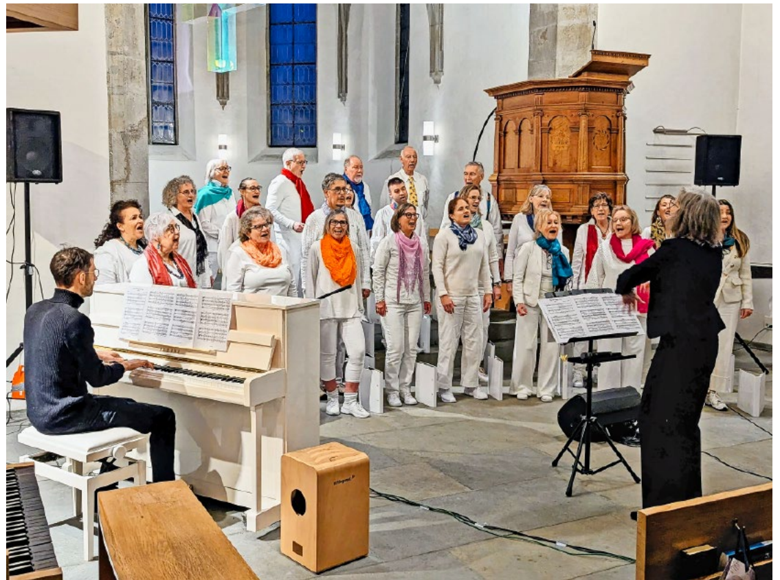
Die Power Voices sorgten mit ihren mitreissenden Songs für gute Laune beim Publikum.

Neujahrskonzert Wenn die vollbesetzte Kirche in Maur rhythmisch mitwippt, zeigt sich schnell: Die Power Voices haben das Jahr 2026 mit viel Schwung eröffnet. Das traditionelle Neujahrskonzert der Kulturkommission Maur wurde am vergangenen Sonntag zu einem stimmungsvollen Auftakt ins neue Jahr.