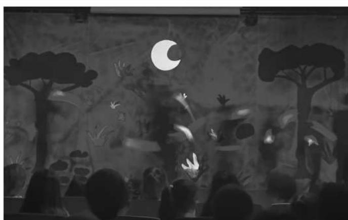
Soloeinlage am Klavier!